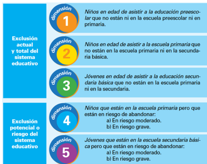
Figura 2 . Dimensiones de la exclusión.