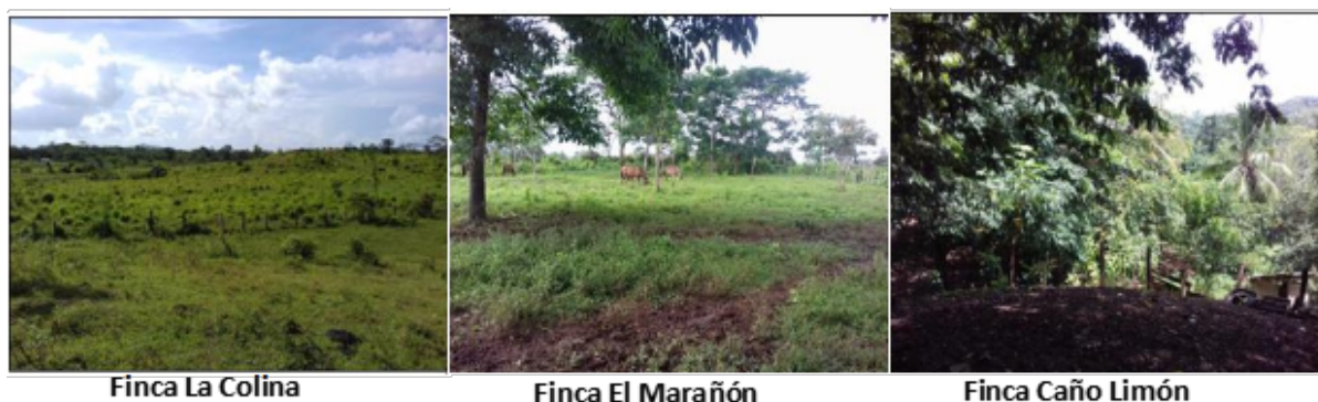
Figura 1 Estado agroecológico de las fincas estudiadas

Análisis de los indicadores agroecológicos para medir la sustentabilidad en los sistemas de producción de las tres fincas en la comunidad de Nazaret I.