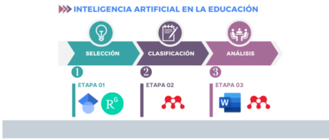
Figura 1 Metodología de construcción del estado del arte de IAEd