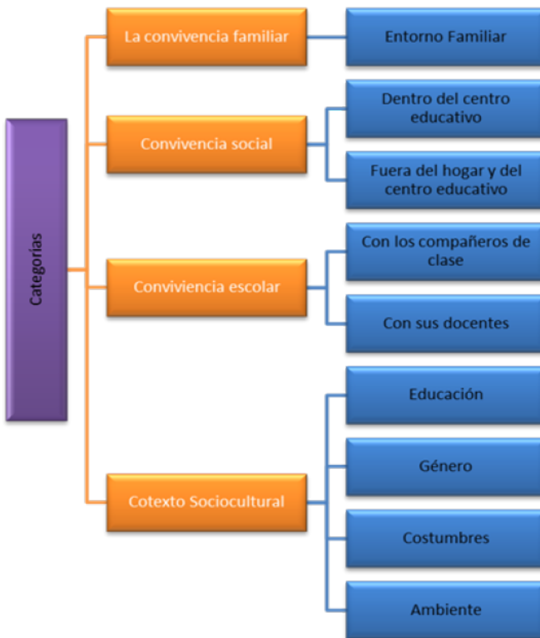
Figura 1 Categorías