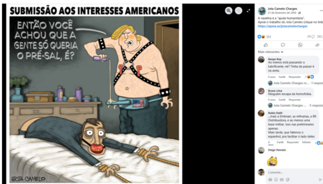
Figura 2 Submissão aos interesses americanos