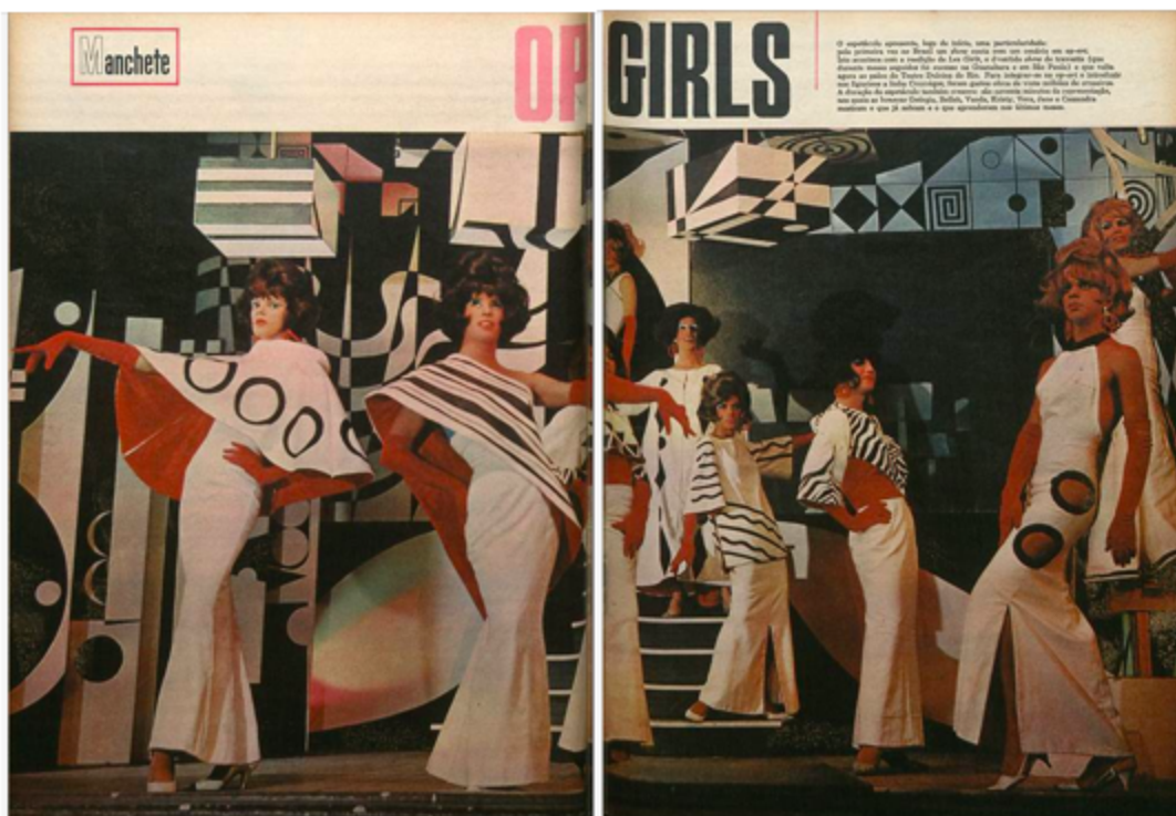
Fuente: Manchete , 9 de abril de 1966, pp. 78-79.