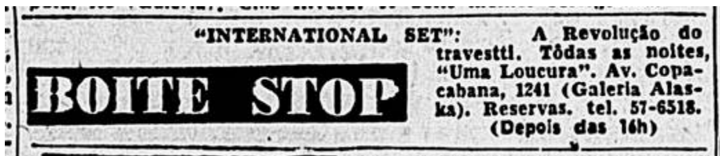
Figura 1 Anuncio del show de International Set