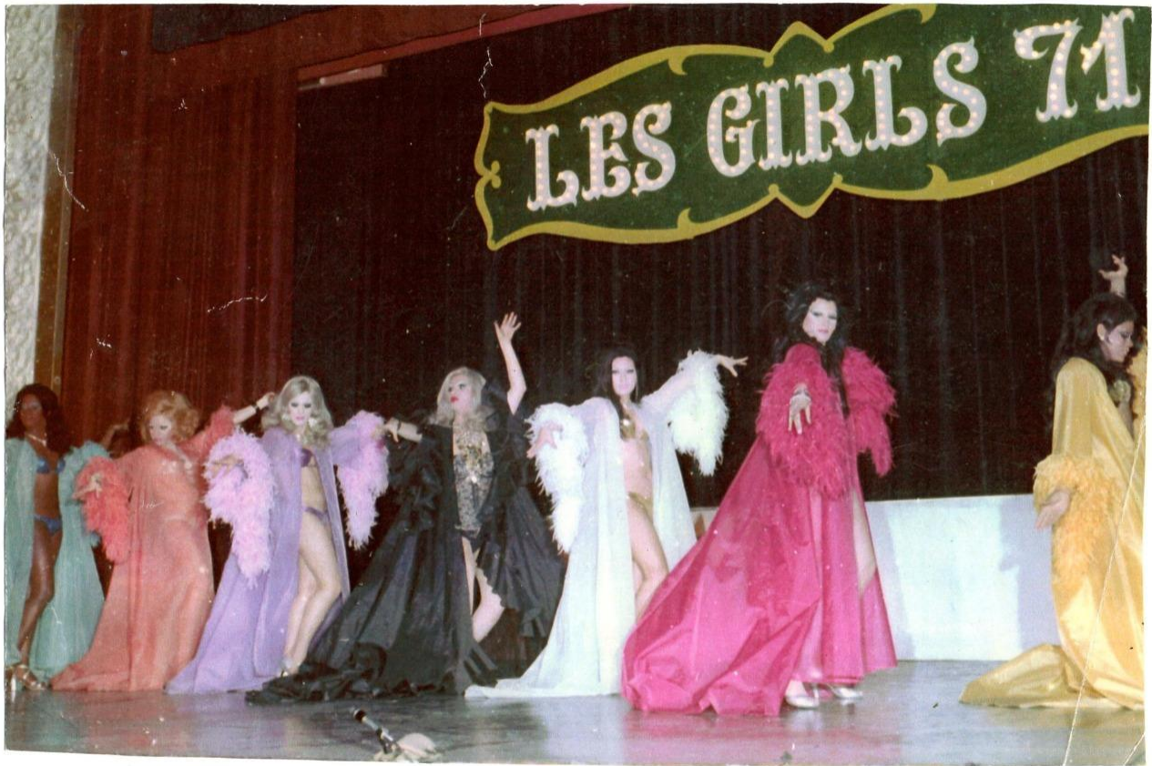
Figura 7 Les Girls 71 ensayando en el teatro El Nacional