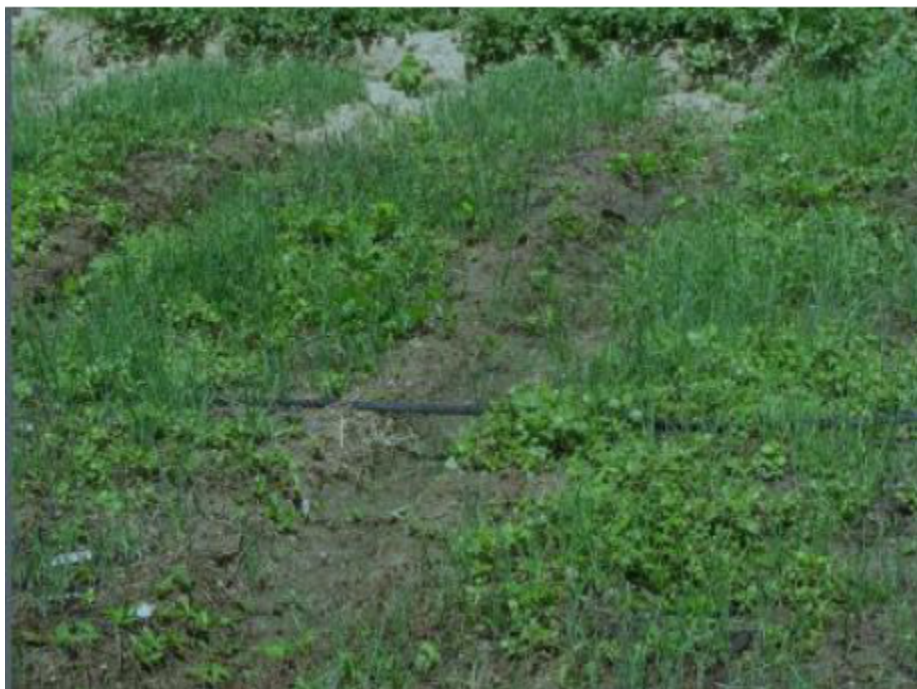
Figura 5 Desarrollo del cultivo. Autores del proyecto.