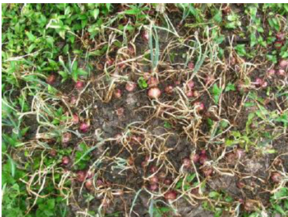
Figura 6 Desarrollo de bulbos. Autores del proyecto.