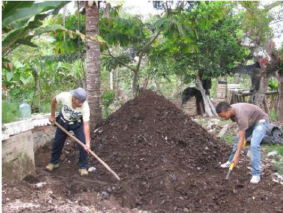
Figura 2. Preparación del Bocashi. Autores del proyecto.