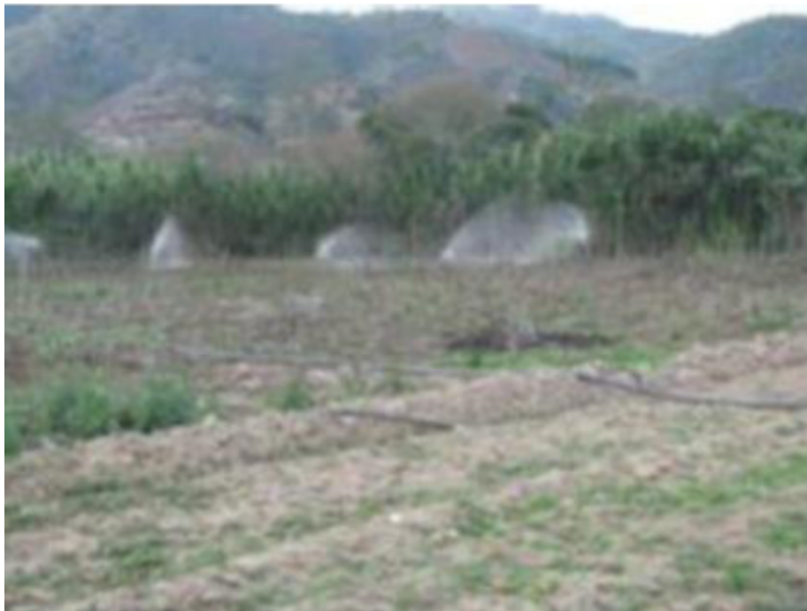
Figura 3. Sistema de riego implementado. Autores del proyecto.