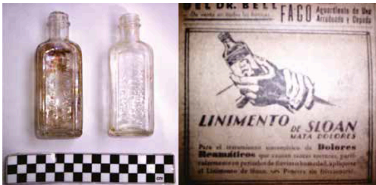
Figura no. 7

Con los horarios de trabajo propios de la industrialización y las arduas tareas fabriles, las dolencias y fatigas musculares se reflejan en la evidencia documental y el registro arqueológico de la primera mitad del siglo XX, como el Linimento Sloan.