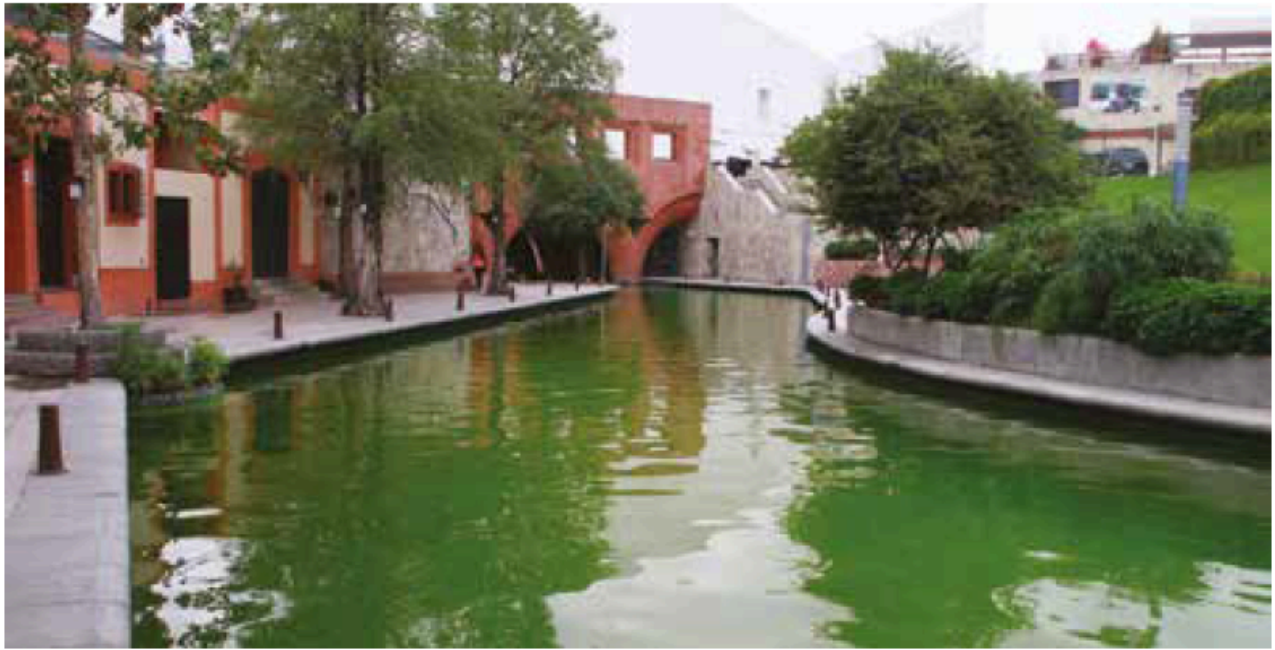
Figura no. 2

El escritor Manuel Payno describió en 1844 un bello paseo donde los habitantes de Monterrey recorrían en familia, tal y como se puede apreciar en el Monterrey del siglo XXI en el paseo de Santa Lucía. Sin embargo, no siempre fue así, pues el área tuvo grandes y graves cambios.