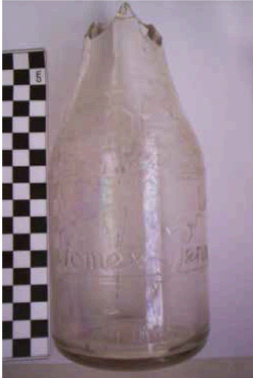
Figura no. 9

Una hoja de lámina con acabado de peltre tricolor y la leyenda Bienvenido Sr. Presidente, parece hacer alusión a la presencia del presidente norteamericano F. D. Roosevelt y su contraparte mexicana M. Ávila Camacho quien benefició al empresariado.