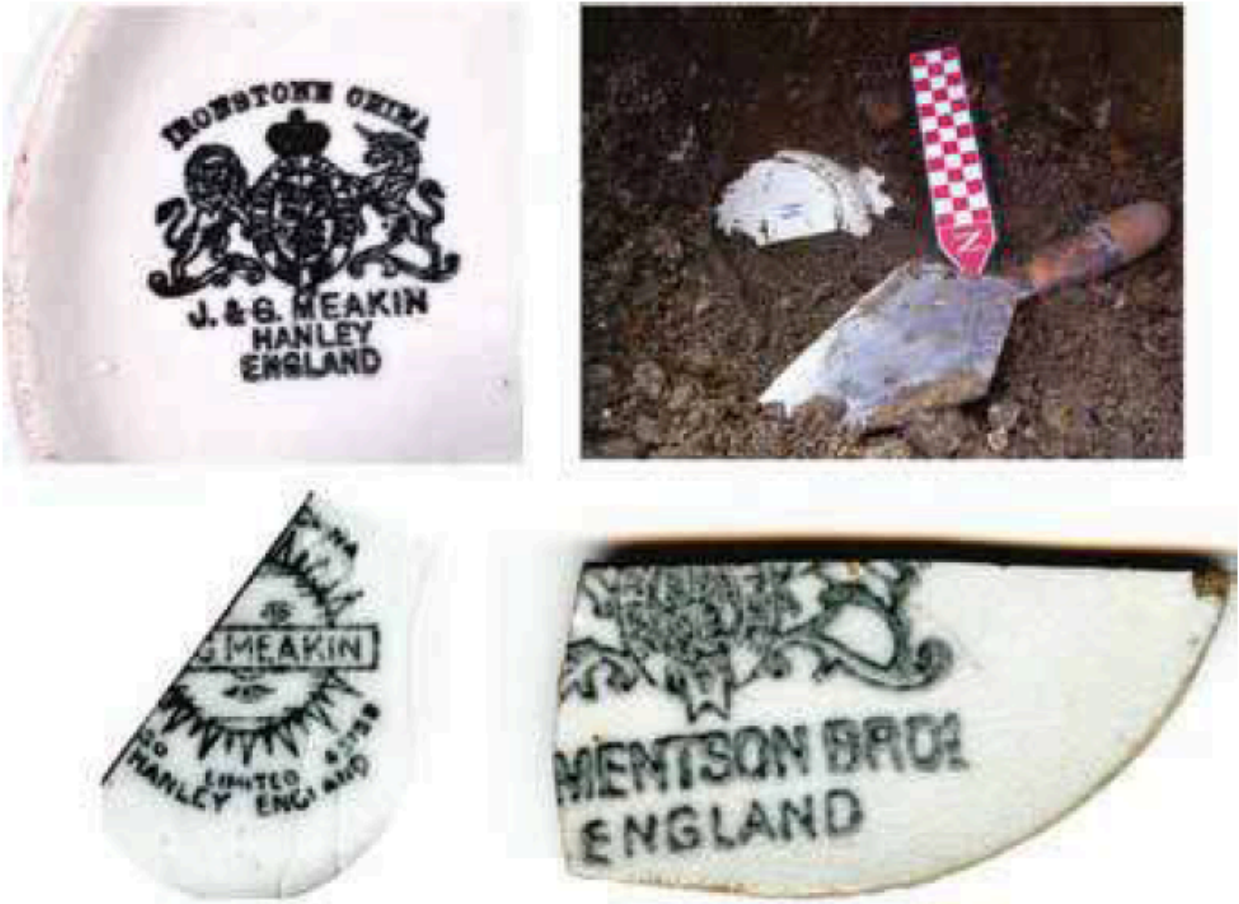
Figura no. 6

A finales del siglo XIX e inicios del XX el poder adquisitivo de un gran sector aumentó, así como la disponibilidad de obtener productos importados legalmente (o de contrabando) como la loza europea y norteamericana.