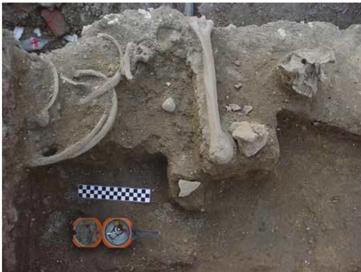
Figura no. 3

Aunado a la nutrida información documental con la que se cuenta, la intervención norteamericana en Monterrey dejó un saldo terrible. Como se puede inferir ante al hallazgo de individuos que aún llevaban alojadas dos balas de mosquete en su cuerpo al momento del entierro.