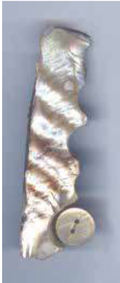
Figura no. 5

Asociado a los talleres de las Tenerías, y denotando evidentemente una producción artesanal, se recuperaron restos malacológicos en distintas fases del proceso de manufactura de botones.