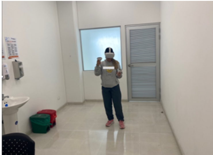
Figura 1. Espacio de evaluación con realidad virtual PAUSA IPS Elaboración propia

El proceso de evaluación se llevó en las instalaciones de PAUSA IPS, centro de salud de la Universidad de Manizales. El espacio de uno de los consultorios de esta institución se adaptó para garantizar la integridad física del participante y para garantizar la maniobrabilidad del dispositivo de RV (véase la Figura 1).