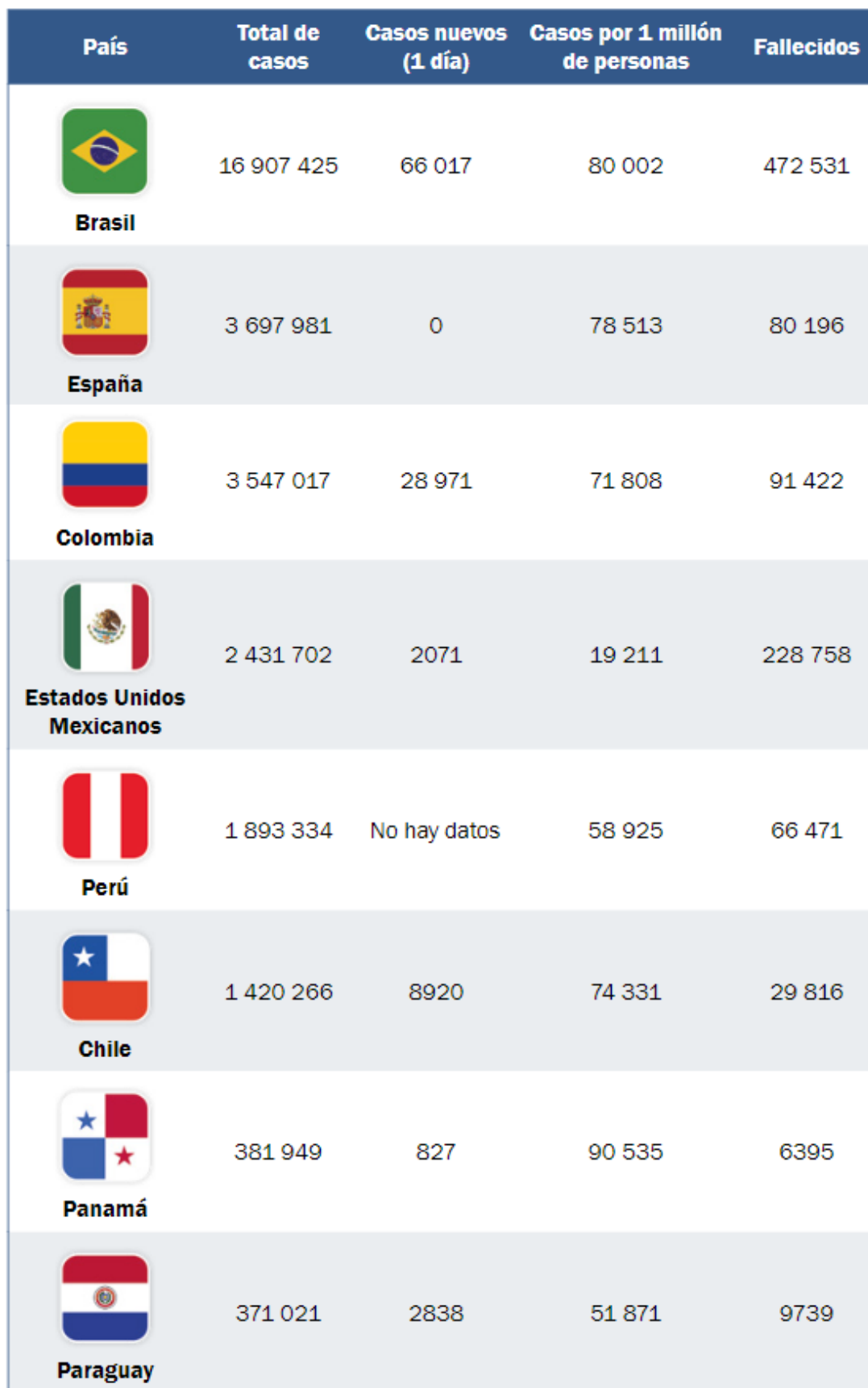
Tabla 2 Los ocho países latinoamericanos con mayor número de casos