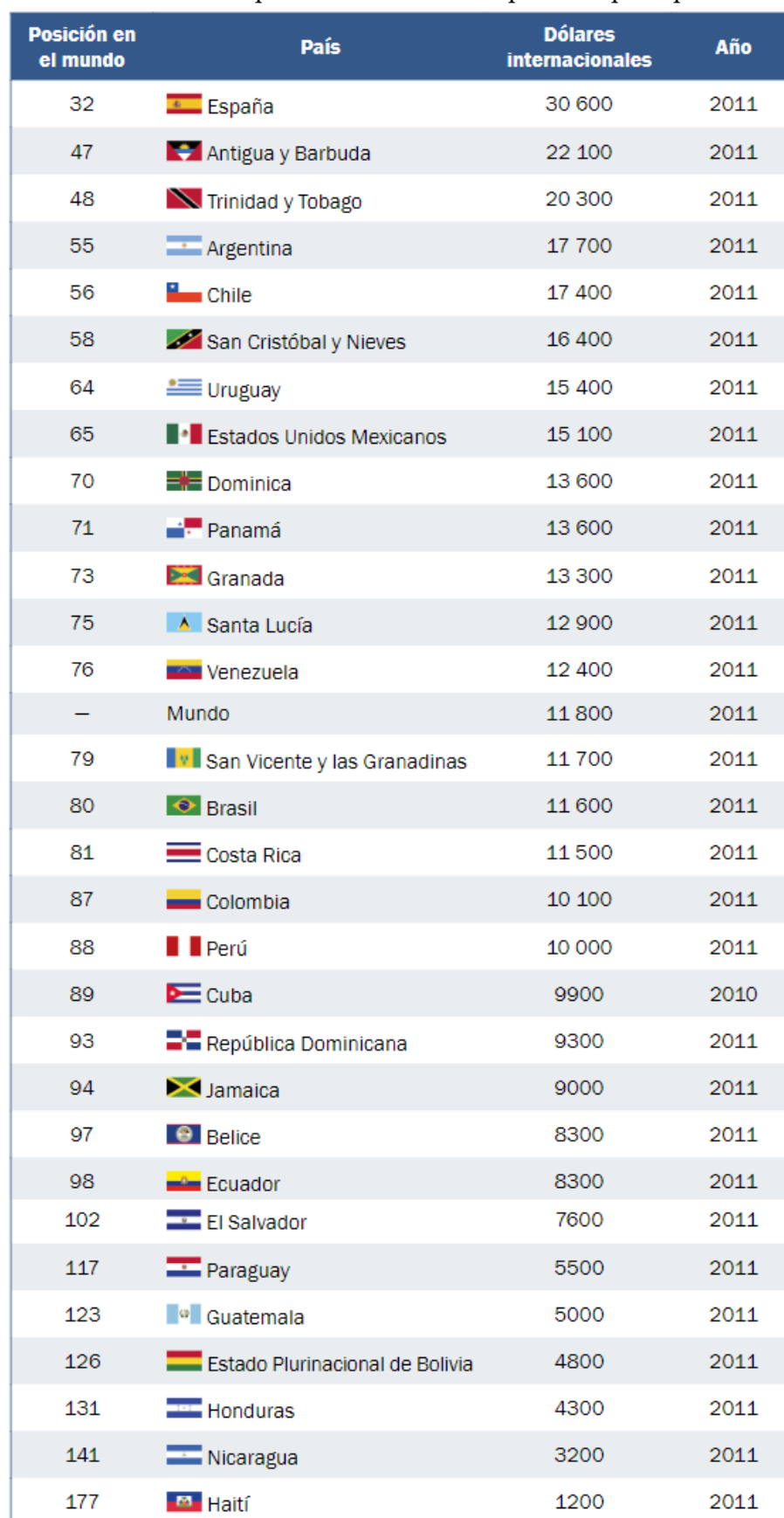
Tabla 3 Posición de los países latinoamericanos por renta per cápita