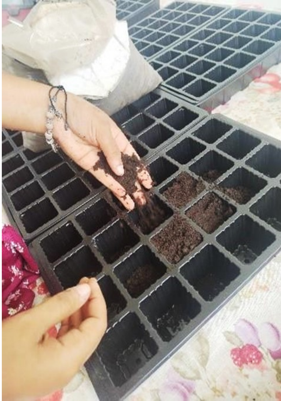
Figura 2 Siembra de semillas de Phaseolus vulgaris

Después de 15 días de la etapa experimental en invernadero, se seleccionaron 8 plantas de cada tratamiento, incluyendo el control, para su trasplante al campo. Se preparó una parcela de 1 x 1,5 metros, arando el suelo para asegurar condiciones óptimas de crecimiento. Las plantas seleccionadas se trasplantaron a esta área para observar su desarrollo en condiciones de campo (Chirino-Valle et al., 2016) (Figura 3)