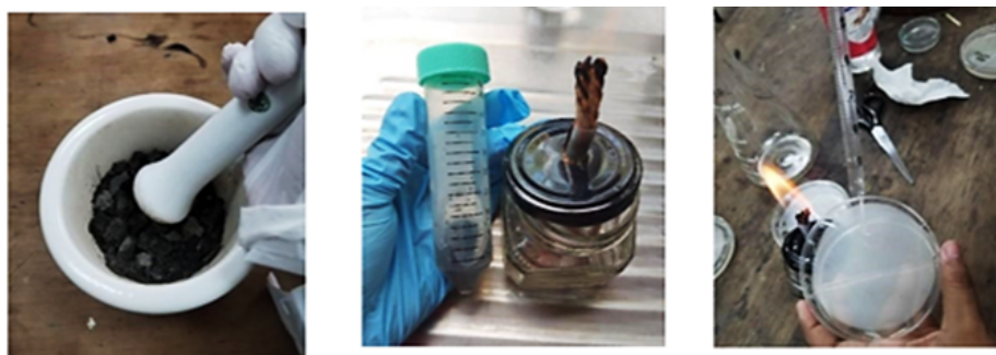
Figura 1 Aislamiento de microorganismos a partir del lodo activado de la PTAR

Los lodos se recolectaron de la planta de tratamiento de aguas residuales (PTAR) y se procesaron para aislar microorganismos beneficiosos. Se maceró 1 g de lodo y se diluyó en agua destilada estéril, realizando diluciones seriadas. Estas diluciones se sembraron en Se utilizaron medios de cultivo selectivos para el aislamiento y crecimiento de cada microorganismo: Agar Cetrimide para Pseudomonas sp., Agar Papa Dextrosa (PDA) para Trichoderma sp., y Agar Extracto de Levadura Manitol (YMA) para Rhizobium sp. (Figura 1).