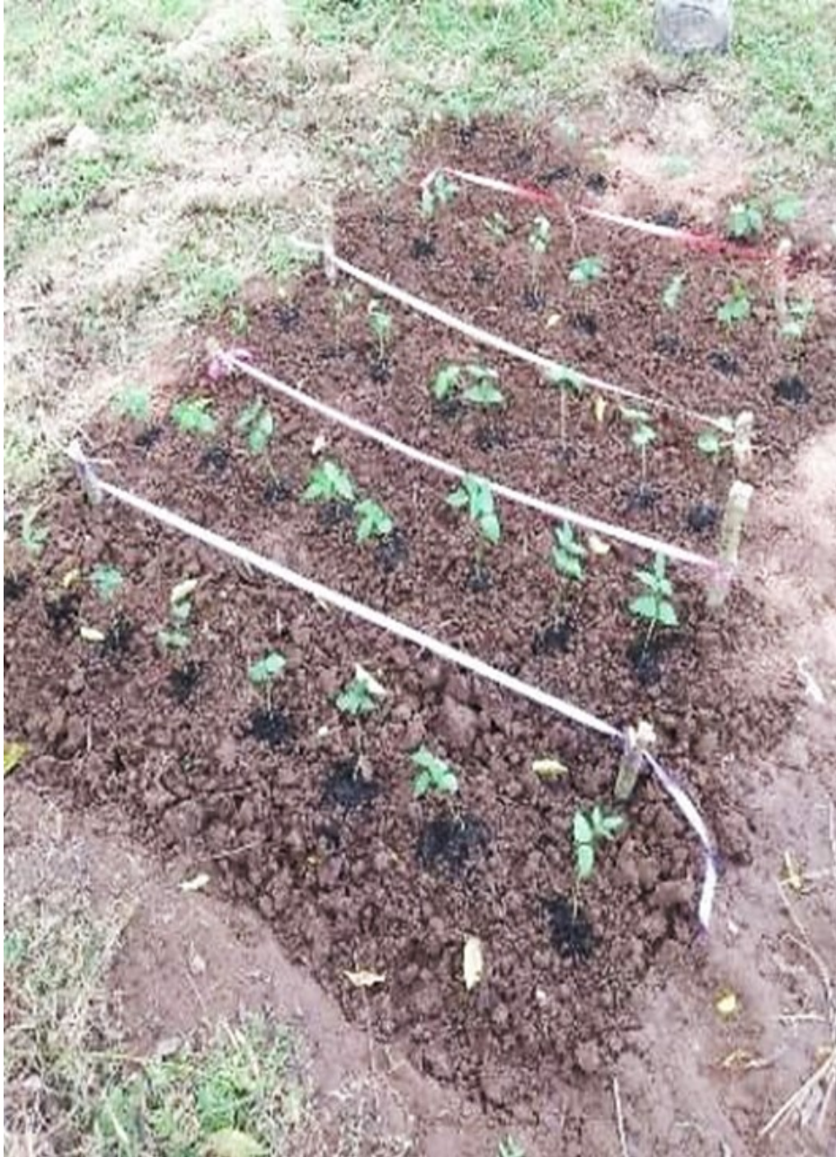
Figura 3 Plantas de Phaseolus vulgaris en terreno

Durante toda la fase experimental, tanto en invernadero como en campo, se evaluaron parámetros de crecimiento como altura de la planta, número de hojas, área foliar, longitud de raíz, y biomasa seca de la parte aérea y raíz (Wall et al., 2015). La fase de campo permitió evaluar el desempeño de las plantas tratadas con los diferentes biofertilizantes en condiciones más cercanas a las de cultivo real.