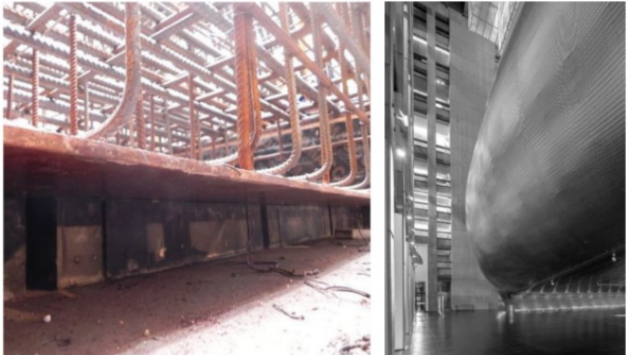
Figura 5 (izq.) - Figura 6 (der.)

Considerando estos valores, y con la intención de cumplir con los criterios NC 18 (Noise Criterion Curves), el equipo de proyecto consideró separar el auditorio de la estructura del edificio. Para lograr este objetivo, se emplearon muros dobles de hormigón con cámara de aire, además de pesadas aberturas y un sistema estructural diseñado para aislar las vibraciones. Este sistema consiste en tres columnas apoyadas sobre asientos de goma, que contribuyen a minimizar las perturbaciones acústicas y mejorar la calidad del ambiente interior (Figura 5). Consecuentemente, se logró una frecuencia de resonancia de 6 Hz en situación de sala llena (Basso, 2021).