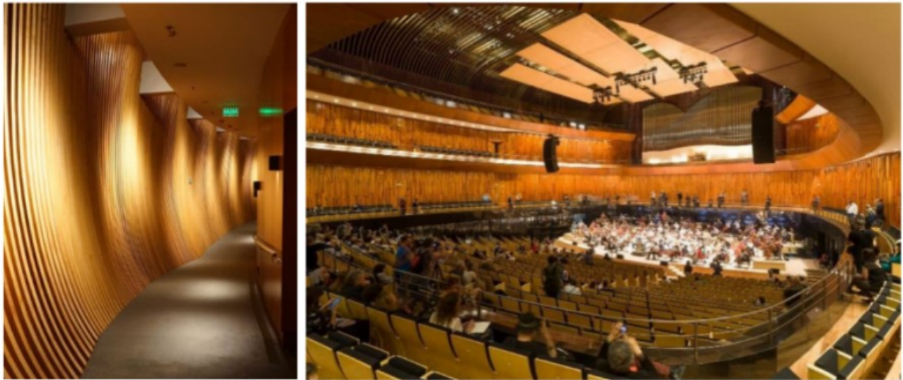
Figura 7 (izq.) - Figura 8 (der.)

Indica los pasillos de circulación que actúan como cámara de reverberación.