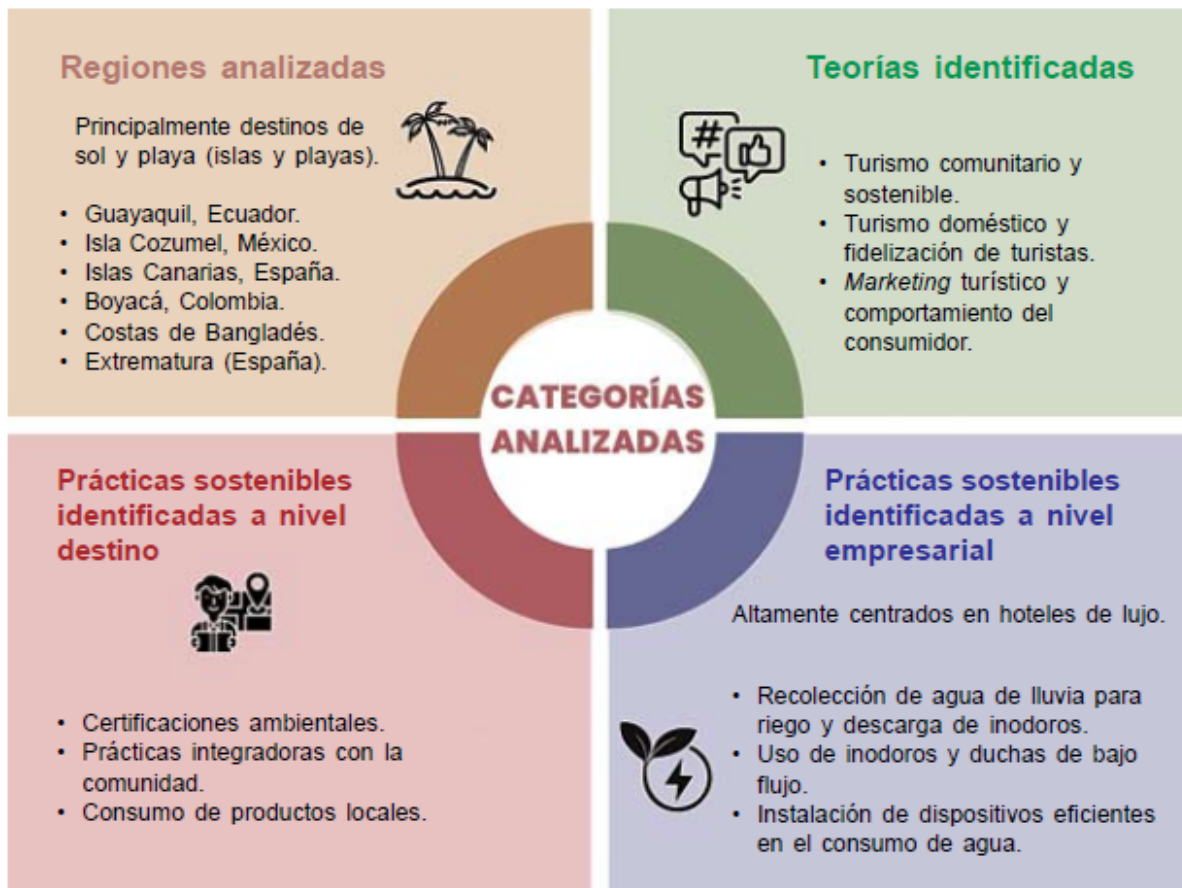
Figura 2 Categorías analizadas a partir de la revisión

En cuanto a la autenticidad y la calidad de las experiencias sostenibles, Zhang et al. (2019) y Yu et al. (2017) señalan que son factores decisivos en la fidelidad de los turistas. Sin embargo, Sangpikul (2018) afirma que existen otros factores (como la amabilidad de la población receptora) más allá de los paisajísticos que determinan la lealtad del turista. Igualmente, pese a las prácticas sostenibles, el estudio de Hendriyani et al. (2020) plantea que la fidelidad de los turistas en un destino se debe particularmente a las características únicas de la comida tradicional balinesa (Indonesia), añadiendo otra capa relevante en la competitividad de los destinos sostenibles. En conjunto, es necesario tener en cuenta que existe una amalgama de componentes, comportamientos y factores que afectan la decisión de retorno, tal y como se hace en la elección de compra en otro tipo de servicios y productos.