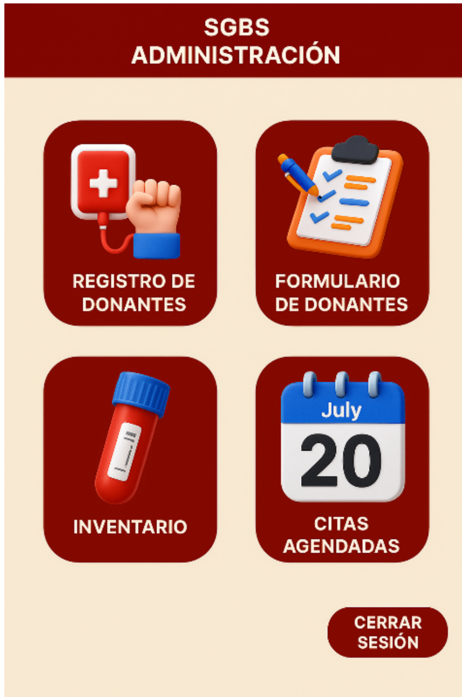
Fig. 6. Interfaz de administrador y los módulos del prototipo SGBS