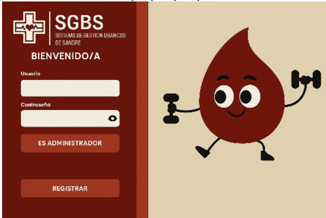
Fig. 4. Interfaz principal del prototipo SGBS

La Figura 5 presenta la interfaz correspondiente al módulo de agendamiento de citas, diseñada para que los donantes puedan seleccionar de manera intuitiva una fecha y hora preferencial para programar su donación.