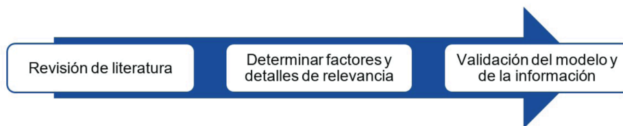
Figura 1 Esquema básico para minería de datos en la elaboración de presupuesto Elaboración propia

Lo presentado anteriormente permite observar que ante la oportunidad del uso de minería de datos en la construcción surge un número sumamente rico de propuestas, necesidades e intereses para el análisis de la información presupuestaria en esta área de construcción en concreto caso residencial, así como una gran cantidad de desafíos en ella. Por lo cual en esta investigación con el sistema CBR se pretende automatizar los cálculos de costos de construcción más exactos.