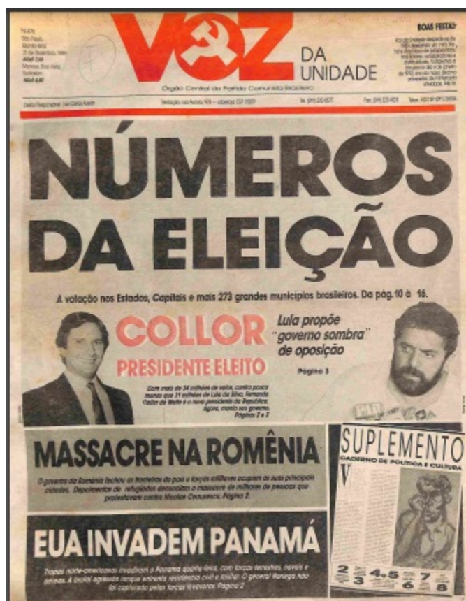
Figura 13 Primeira página da edição nº 476. VOZ DA UNIDADE, 21 de dezembro de 1989, p. 1.

Collor, que já vivia dentro da riqueza. Novamente podemos encontrar a produção de sentidos no periódico, que fazem o leitor sentir determinadas sensações ou emoções. Nesta edição, a Voz se direciona para a propaganda final antes do evento da votação; logo, com os ânimos exaltados no país diante da escolha do novo presidente, o jornal não poderia lançar imagens pouco chamativas. A escolha de imagem e texto escrito, bem como da diagramação das primeiras páginas, tanto da edição do jornal quanto do suplemento, representavam uma última tentativa de divulgar o rosto e nome do político petista.