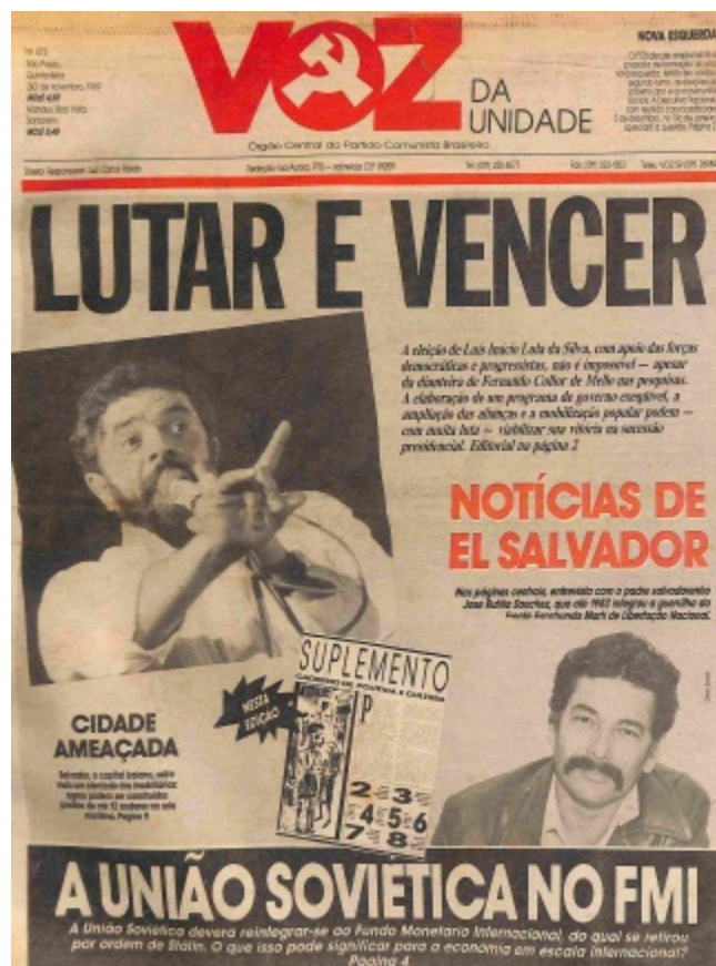
Figura 3 Primeira página da edição nº 473. VOZ DA UNIDADE, 30 de novembro de 1989, p. 1.

De acordo com Charaudeau (2019, p. 60-92), o discurso propagandista em um meio de comunicação tem como intuito seduzir o receptor; dessa forma, o conteúdo não é pensado da mesma maneira que um texto puramente informativo. Portanto, mais do que um “fazer saber”, o veículo de informação estará preocupado com o “fazer sentir” de seu leitor.