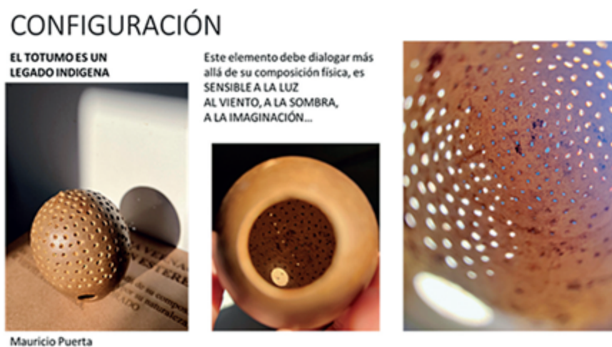
Figura 6 Ejercicio de configuración espacial de un objeto contenedor

A partir de este mito, el grupo de estudiantes empezó el proceso de configuración espacial en una propuesta de perforar circularmente el totumo, disminuyendo el tamaño de sus orificios para regular el paso del viento y la luz a través de cada uno durante el día y la noche. De esta forma, el totumo se llenó de un suave arrullo misterioso de luminosidad en su interior, que, junto a las sombras, dejaba escapar los hilos de agua, aire y luz por cada hueco. Las culturas ancestrales prehispánicas se han caracterizado por su estrecho vínculo y diálogo con la naturaleza; de igual manera, han aprovechado sus propiedades medicinales y alimenticias a medida que han ido incrementando su conocimiento botánico, gastronómico y curativo de las plantas. Este inseparable lazo sagrado con la tierra transfiere características sensibles de este nuevo espacio configurado que, con el viento, el sol y la sombra, la luna y la penumbra, dan vida a los mitos y relatos que se trenzan con los territorios.