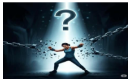
En el centro de la imagen una mujer rompe dos cadenas con los brazos extendidos, mientras un gran signo de pregunta iluminado por un rayo de luz aparece sobre su cabeza. El fondo es oscuro y la luz cae desde arriba.

Esta imagen representa un concepto clave en la pedagogía de Freire (1970). Nos enseña que la libertad no se nos da, sino que se conquista a través de la lucha y la reflexión sobre nuestra propia realidad. Se visualiza una mujer rompiendo cadenas, con un signo de pregunta arriba de su cuerpo, iluminando su intención.