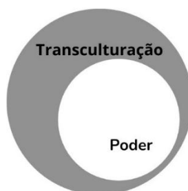
Figura 3 – Transculturação e poder