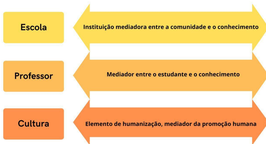
Figura 1 – Prerrogativas do currículo