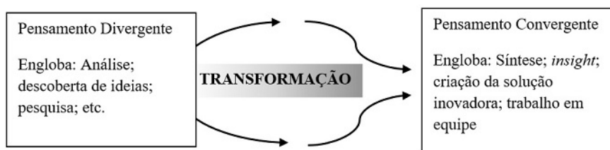
Figura 1 Pensamento divergente e convergente

desenvolvimento de pessoas para o trabalho em equipe, assim como cria a confiança na sua capacidade criativa. Na figura 1 apresentam-se relações entre Pensamento divergente e convergente.