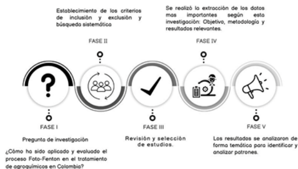
Figura 1. Fases de la revisión sistemática de acuerdo con Arksey y O' Malley enfocado al proceso Foto-fenton en agroquímicos en Colombia.

Durante la revisión bibliográfica realizada, se encontró que la base de datos que proporcionó la mayor cantidad de artículos relevantes fue ScienceDirect. Esta plataforma multidisciplinaria contiene una amplia variedad de publicaciones científicas y técnicas, lo que la convierte en una fuente clave para la investigación. Durante esta revisión, se consideró una amplia variedad de artículos