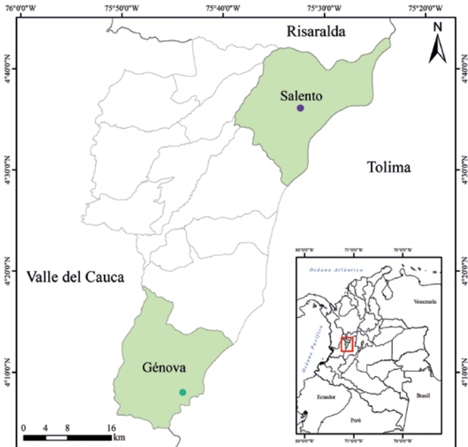
Figura. 1. Localización geográfica de los registros del género Histiotus en el departamento del Quindío, Colombia.

del género Histiotus , en la Finca Alegrías ( 04^{\circ}36'07'' N y 75^{\circ}32'22'' O, 2581 msnm) del municipio de Salento (Fig. 1). El individuo no fue colectado por falta de elementos que permitieran su preservación y transporte. Sin embargo, con el ánimo de documentar la descripción del murciélago, se realizó el registro fotográfico del individuo, en el que se apreciaron algunas de sus características morfológicas, las cuales, a pesar de las condiciones fortuitas del episodio, se registraron en combinación con la estimación de medidas anatómicas del individuo, permitiendo su identificación hasta el nivel de género, con el apoyo de un grupo de expertos.