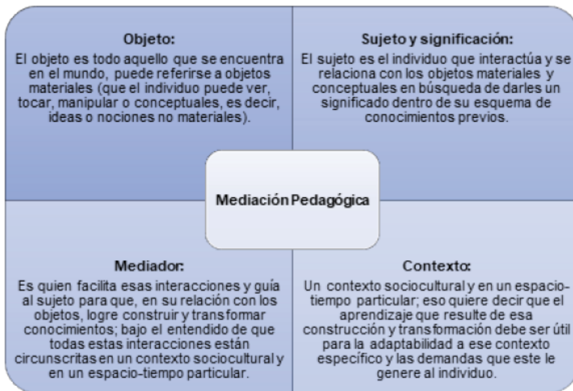
Figura 1 Elementos que intervienen en la mediación pedagógica Información tomada de Cole (citado por Flórez et al., 2016).

Además, en la figura 1 se observan elementos que deben considerarse cuando se habla de mediación pedagógica.