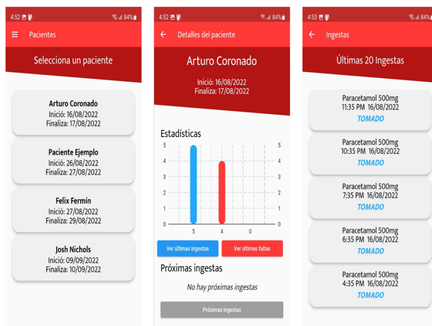
Figura 4. Interfaz de la App Pill Take.