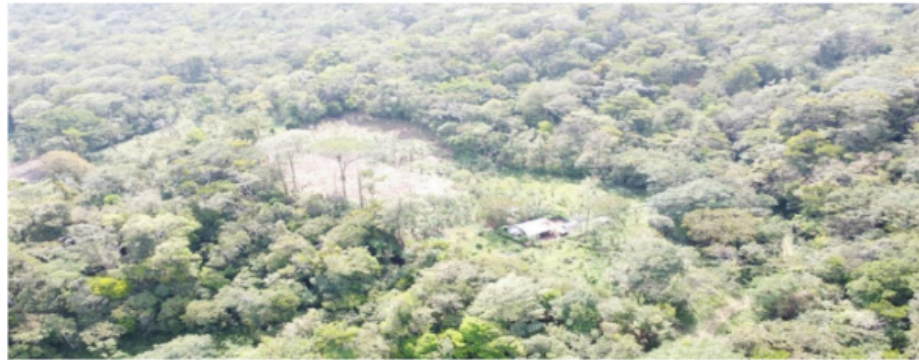
Figura 7 Vivienda en el centro del bosque y deforestación alrededor de esta

En la figura 6 se hace evidente que los frentes de deforestación han cambiado y la persona deforestan sin ningún orden establecido como podemos observar en la imagen.