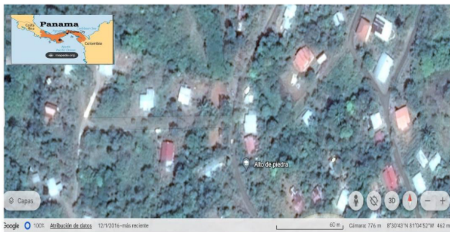
Figura 1 Ubicación del área de estudio

La figura 1 muestra el área de estudio, este se encuentra ubicado en la comunidad de Alto de Piedra con coordenadas N 80 30"43 W 810 04" 52.