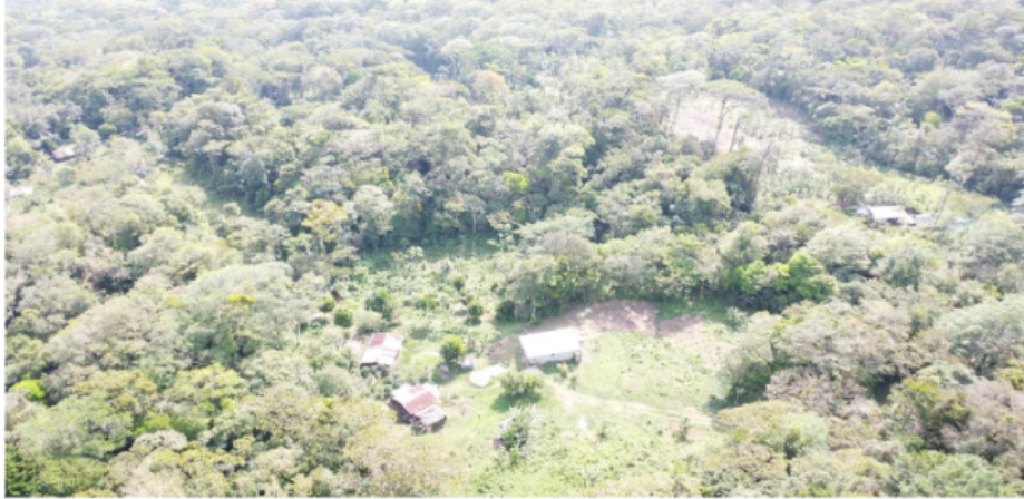
Figura 6 Desorden en la actividad de deforestación

En la figura 6 se hace evidente que los frentes de deforestación han cambiado y la persona deforestan sin ningún orden establecido como podemos observar en la imagen.