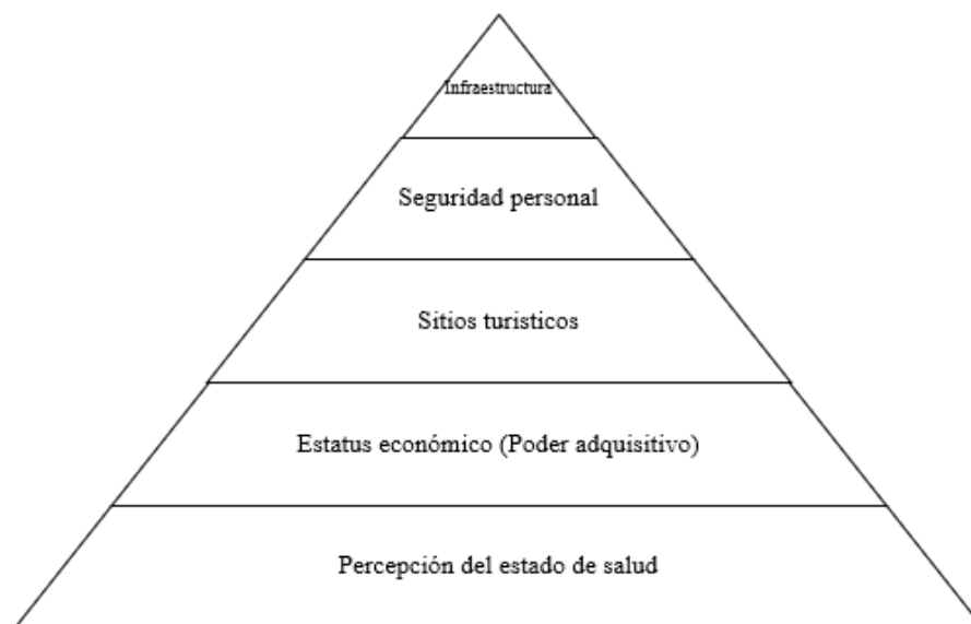
FIGURA 2 Factores determinantes en la decisión de viaje en las personas mayores

Al respecto, es importante apuntar el peso de los factores determinantes en la decisión de viaje para las personas mayores (Figura 2). Sin duda, la percepción del estado de salud (PES) constituye la base de la pirámide, por tratarse del factor decisor principal. Ya que las enfermedades o una PES negativa son factores limitantes en la motivación de viaje de los turistas senior. Otros aspectos fundamentales son: el estatus económico (poder adquisitivo), la oferta de sitios turísticos, seguridad personal e infraestructura disponible en los destinos.