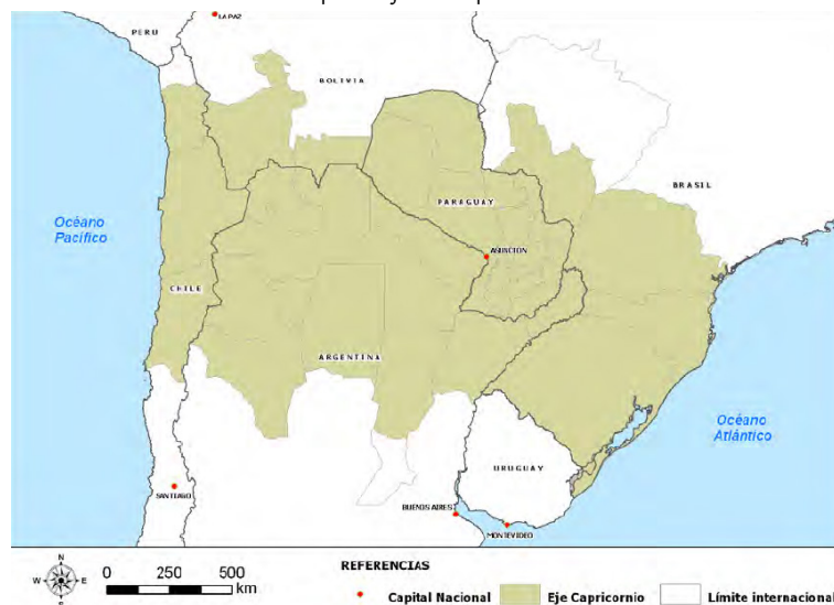
Mapa 1. Eje de Capricornio