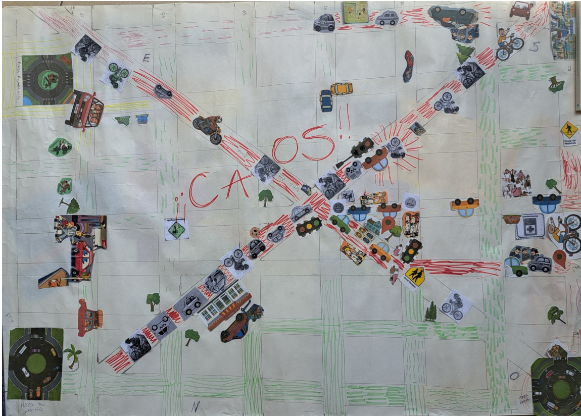
Figura 3. Cartografía del conflicto: caos urbano y saturación simbólica