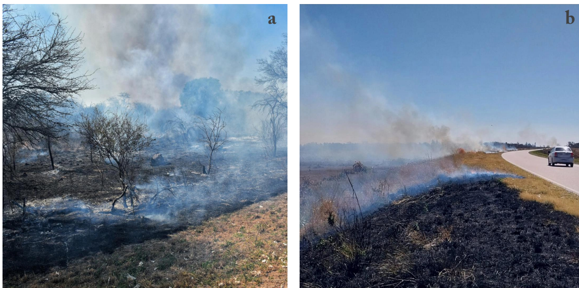
Figura 3. Incendios en la región de los Bajos Submeridionales

Nota: a) incendio en la banquina de la Ruta Nacional N° 89 que conecta a la provincia de Santiago del Estero con Chaco; b) focos de incendio en la margen de la Ruta Nacional N° 98 que une a las provincias de Santa Fe con Santiago de Estero