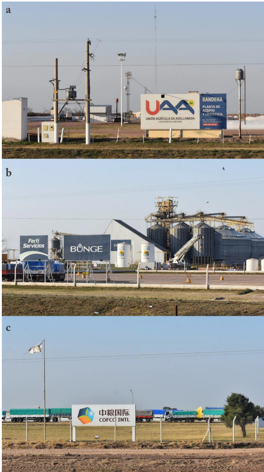
Figura 2. Empresas transnacionales ubicadas sobre la Ruta Nacional N° 98 en la localidad de Bandera, Santiago del Estero

Nota: empresas del agronegocio: a) Unión Agrícola de Avellaneda; b) Bunge; c) Cofco