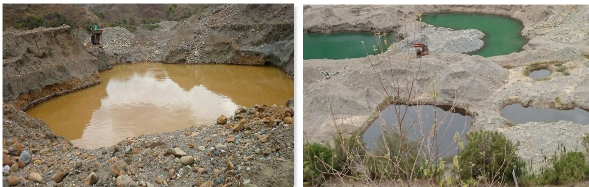
Figura 3. Cráteres en el Río Sambingo 2016