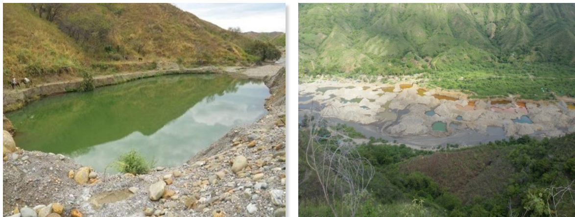
Figura 2. Minería Aluvial en el río Sambingo

La actividad minera generó modificación del cauce del río por la construcción de trinchos obstaculizando el flujo normal de la corriente, afectación al lecho del río y desestabilizando los niveles de la lámina de agua de la fuente como su misma hidráulica, así como la retención del material de arrastre, modificación en los márgenes del río y sus zonas de inundación, aumentos en las cargas de sedimentos, acumulación de material removido, socavamientos en la base de los taludes en algunos sectores y tramos del río lo cual genera la desestabilización del mismo. (CRC, 2016a, p. 4)