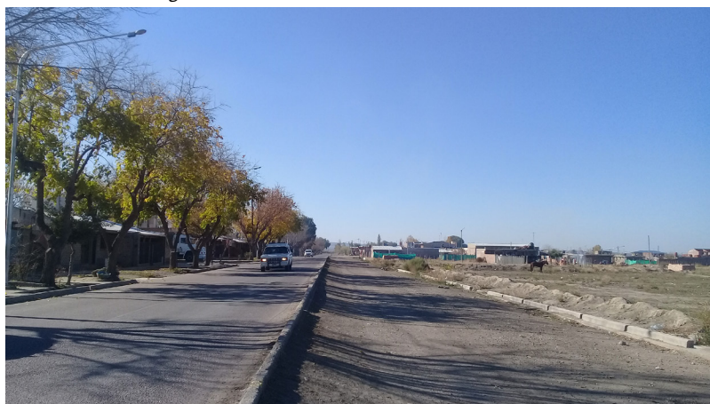
Fotografía 2. Loteo Bazán desde el B° Cordón del Plata

Se llama loteo Bazán, que es una señora que compró y entró a vender, como que vendió todo urbanizado, y les hizo un cuento a los compradores, y no hay nada. Entonces empezaron a reclamar los terrenos y se los dio así nomás, y encima no tienen luz para cada casa, tienen un solo medidor. Tienen un transformador que puede abastecer 50 casas y hay 150 (...) Es gente de acá, y gente del norte, de Jujuy, Salta y hay mucha gente de Bolivia. (E7, obrero agrícola, 20-25 años)