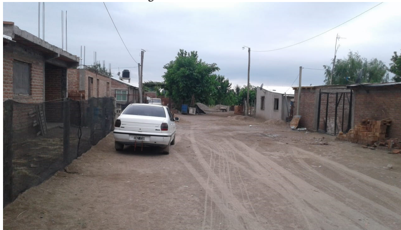
Fotografía 1. Barrio de Villa Seca

El proceso de expulsión de población de las explotaciones, ya fueran productores o trabajadores, tampoco ocurrió de manera planificada y tuvo que ser resuelta sobre la marcha de manera individual o en el mejor de los casos de forma asociada entre vecinos. La localidad de Villa Seca del Departamento de Tunuyán es representativa de una urbanización que creció de forma espontánea a medida que fue aumentando su población (Fotografía 1). El pueblo estuvo durante mucho tiempo ligado a la actividad ganadera. Incluso hacia fines de la década de 1950, Inchauspe (1957) destacaba la vocación ganadera de los pueblos del oeste de Tupungato como Los Sauces y Villa Seca, principalmente dedicados a la cría de ganado ovino, caprino y en menor medida bovino. A partir de la segunda mitad del siglo XX, con el auge de la extracción de agua subterránea, la zona experimentó un crecimiento de explotaciones agrícolas de tamaño intermedio. Si bien creció la población en la zona, la mayoría se asentó en las nuevas fincas sin que ocurriesen grandes cambios en el pueblo. No fue sino hasta la instalación de las nuevas bodegas en el piedemonte que Villa Seca tuvo un crecimiento considerable y repentino.