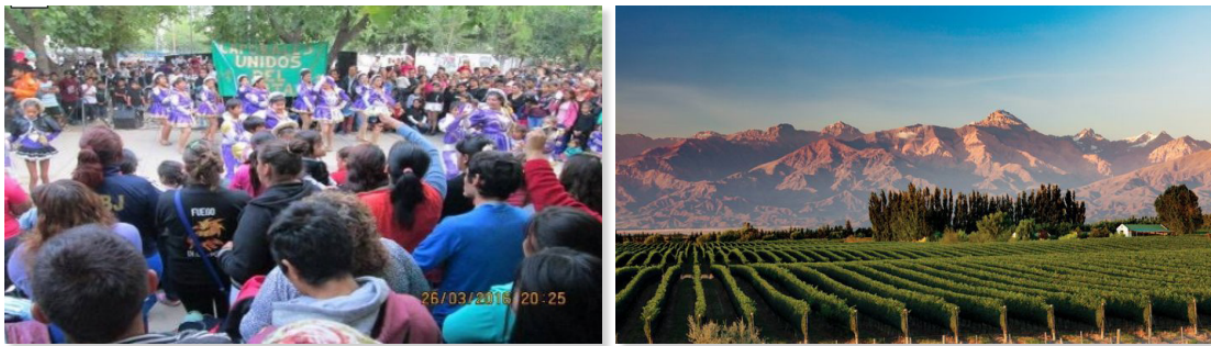
Fotografía 3 y 4. Paisajes para la vida versus paisajes de exportación