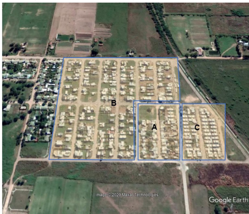
Figura 2. Nueva Esperanza Este . Áreas según intervenciones habitacionales

Referencias: A) primeras viviendas de la zona, conocidas como “quinchitos” (2010); B) viviendas enmarcadas en Pro.Cre.Ar (edificadas entre 2015-2016 aproximadamente); y C) viviendas correspondientes al Programa de Reconstrucción de la Ciudad (2016-2017)