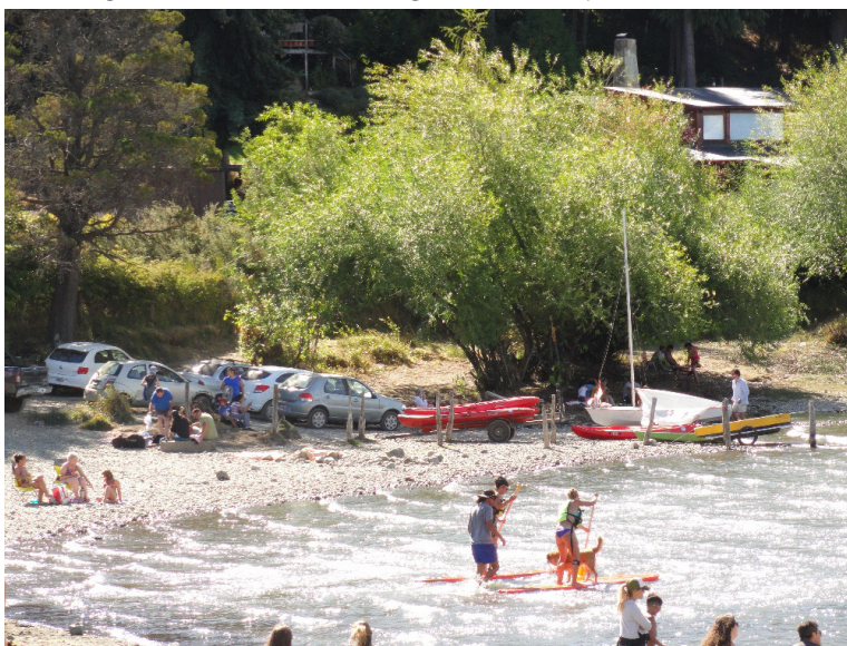
Figura 3. Prestadores desplegando equipos y dictando clases