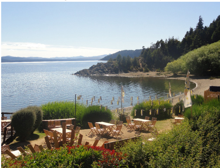
Figura 2. Restaurante sobre la playa

nible para la práctica de actividades de las mayorías (por ejemplo, los bañistas), frente al espacio que requieren los prestadores turísticos para desplegar su equipamiento sobre la misma playa, tal es el caso de las concesiones de confiterías (Figura 2), alquiler de equipamiento náutico (Figura 3), guardería de embarcaciones, entre otras. Estos procesos evidencian una injusticia espacial en un ámbito de borde urbano generada a partir de diferentes prácticas asociadas con el ocio y el tiempo libre de los visitantes, tanto turistas como recreacionistas.