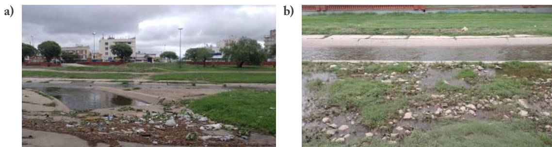
Figura 1. El Suquía como vertedero

Referencias: a) paisaje del río con residuos luego de una crecida; b) aguas servidas estancadas en los márgenes del Suquía