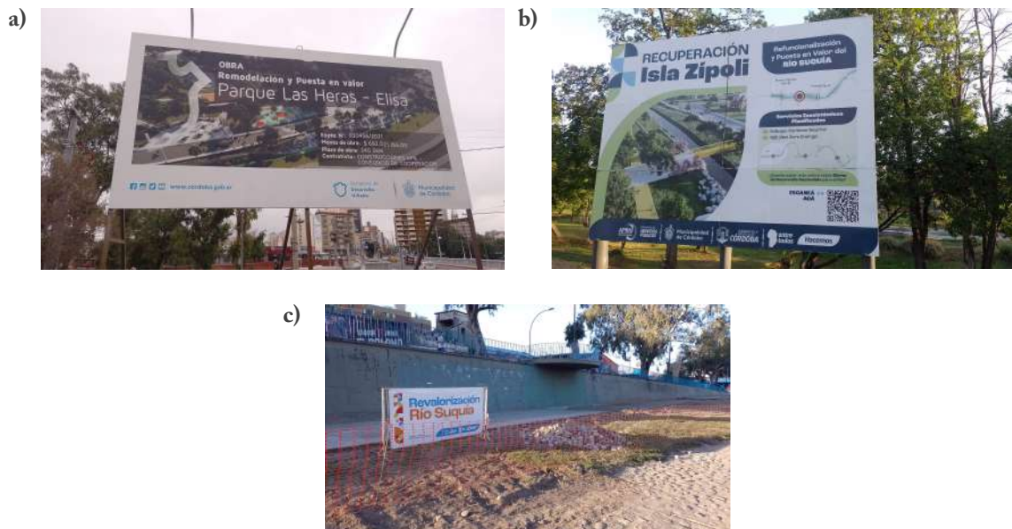
Figura 3. Cartelería alusiva a obras en la costanera del Suquía

Referencias: a) cartel con imagen y leyenda sobre la recuperación y puesta en valor del Parque Las Heras–Elisa; b) cartel que anticipa la recuperación de la Isla Zípoli; c) cartel móvil en el río Suquía con referencia a la revalorización de la costanera