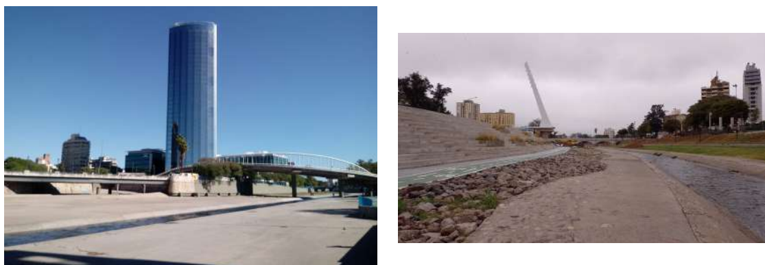
Figura 7. Vistas del río Suquía y sus riberas hormigonadas