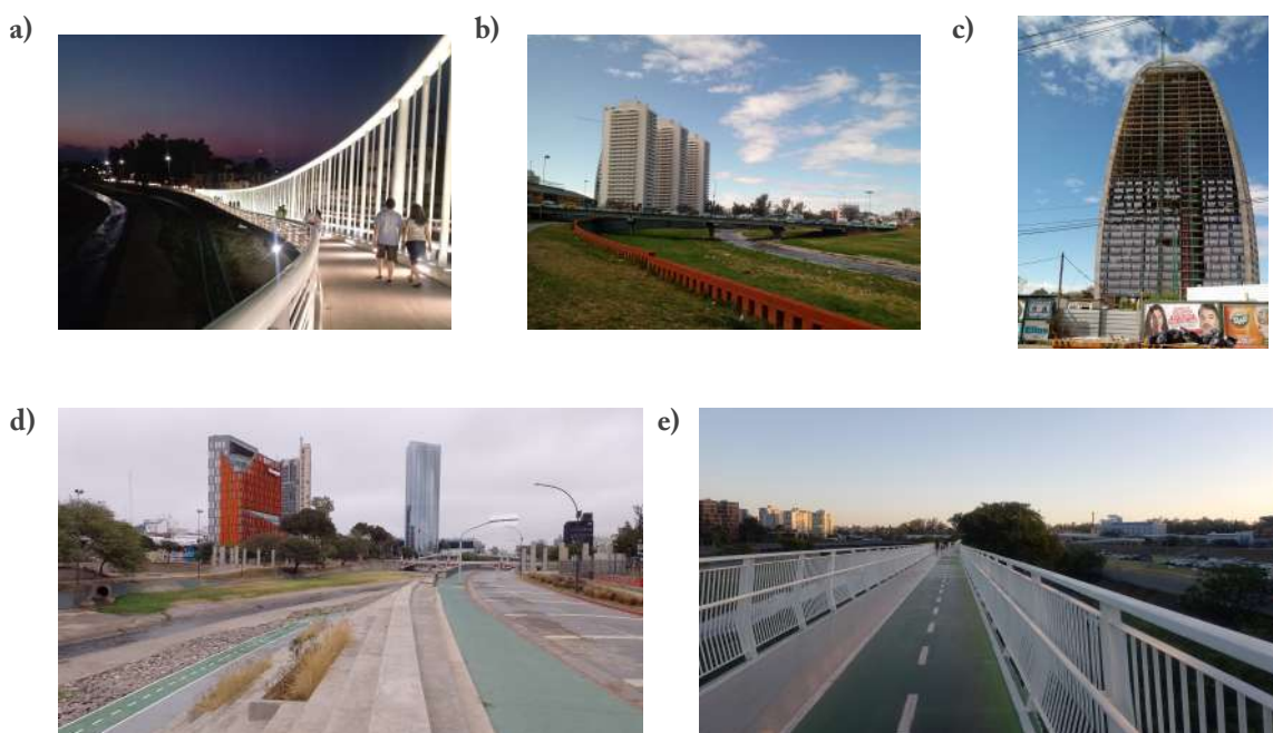
Figura 6. Arquitecturas para la recuperación del Suquía

Referencias: a) puente Gobernador Mestre; b) barrio privado Torres Cardinales; c) Alto Paz Tower, en construcción; d) vista de la Torre Capitalinas, Coral State Tower y Casa Naranja desde el parque Las Heras-Elisa; e) vista de bicisenda elevada sobre el río Suquía.