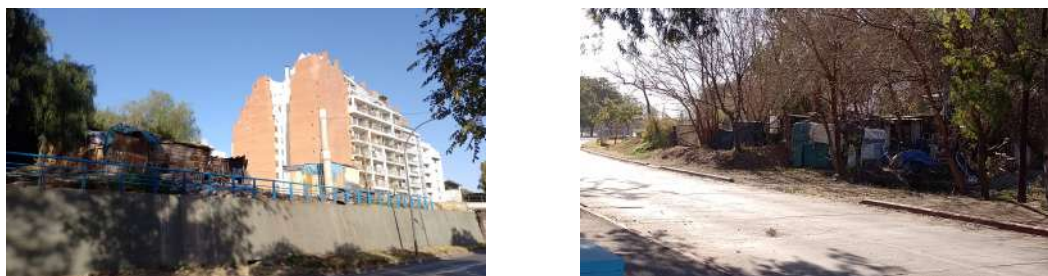
Figura 8. Viviendas informales frente al río Suquía

Referencias: a) barrio Providencia; b) barrio General Paz.