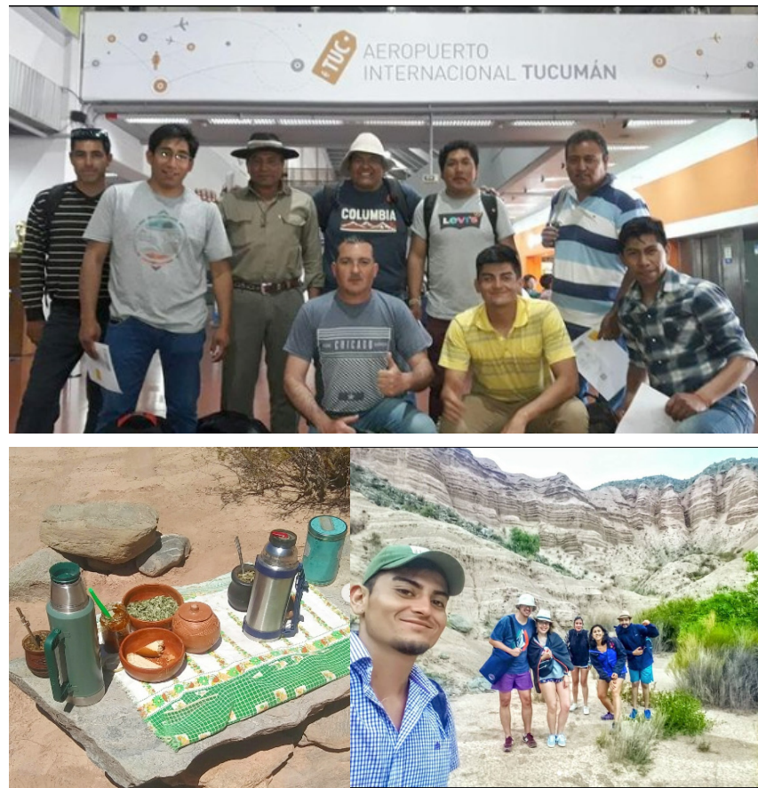
Figura 3. Fotos del trabajo del proyecto comunitario “Con Corazón Nativo”