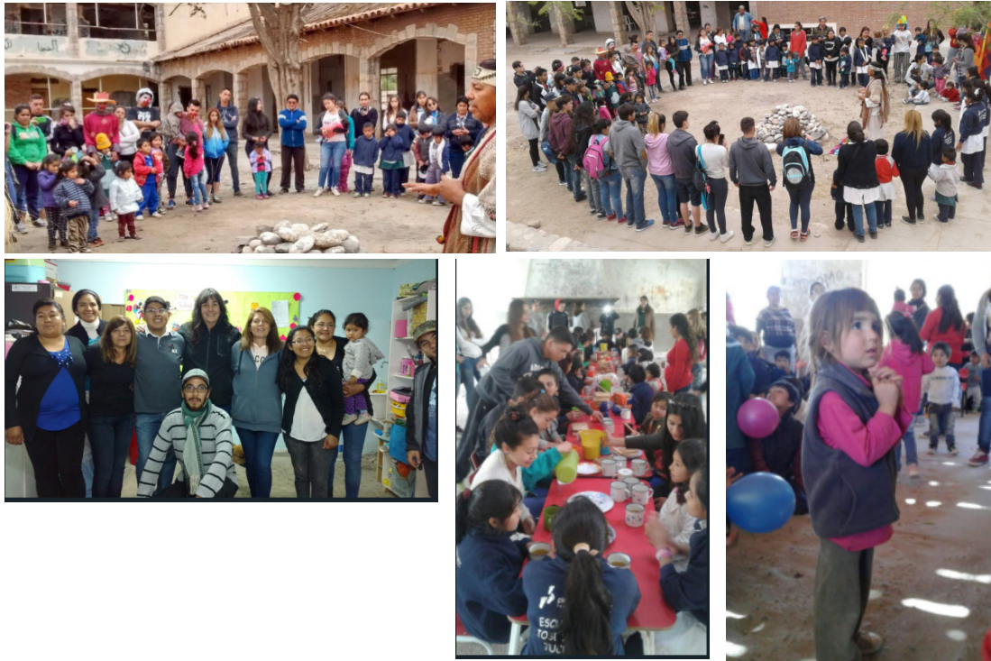
Figura 5. Fotos del trabajo del proyecto de vinculación estudiantil “Viaje solidario estudiantil Amaicha del Valle”