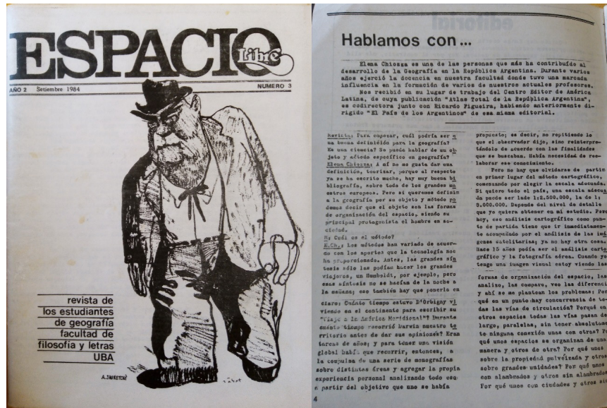
Figura 3. Tapa con dibujo de Jauretche y sección de entrevistas Fuente: Espacio Libre, (3)

para construir su propio campo de conocimientos, como así también para colaborar en la configuración de un nuevo plan de estudios.