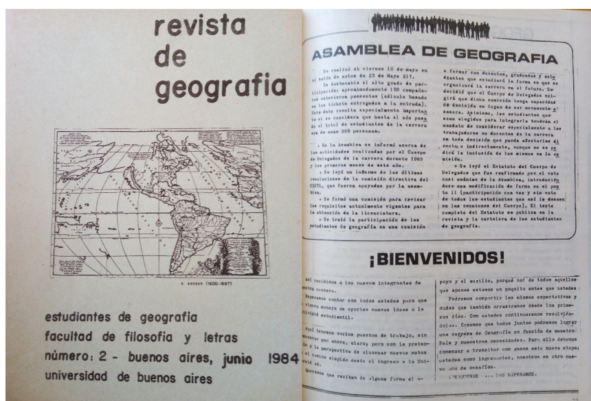
Figura 4. Tapa y aviso de asamblea

Para mediados de 1984, estos deseos de ser parte del armado de la reformulación de la carrera de Geografía, se materializan con la inclusión de estudiantes junto a docentes y graduados en lo que sería una comisión específica para tratar la reforma del plan de estudios. En rigor, su anuncio publicado en la Revista de los Estudiantes de Geografía n° 2 (figura 4), a través de una reseña sobre el temario tratado en asamblea de estudiantes, no solo visibilizaba la concreción de la aclamada participación estudiantil, sino que, también, ponía de manifiesto el pleno funcionamiento democrático de la universidad, en donde las decisiones concernientes a la Facultad y a cada carrera, pasaban a estar en manos de un cogobierno de tres claustros.