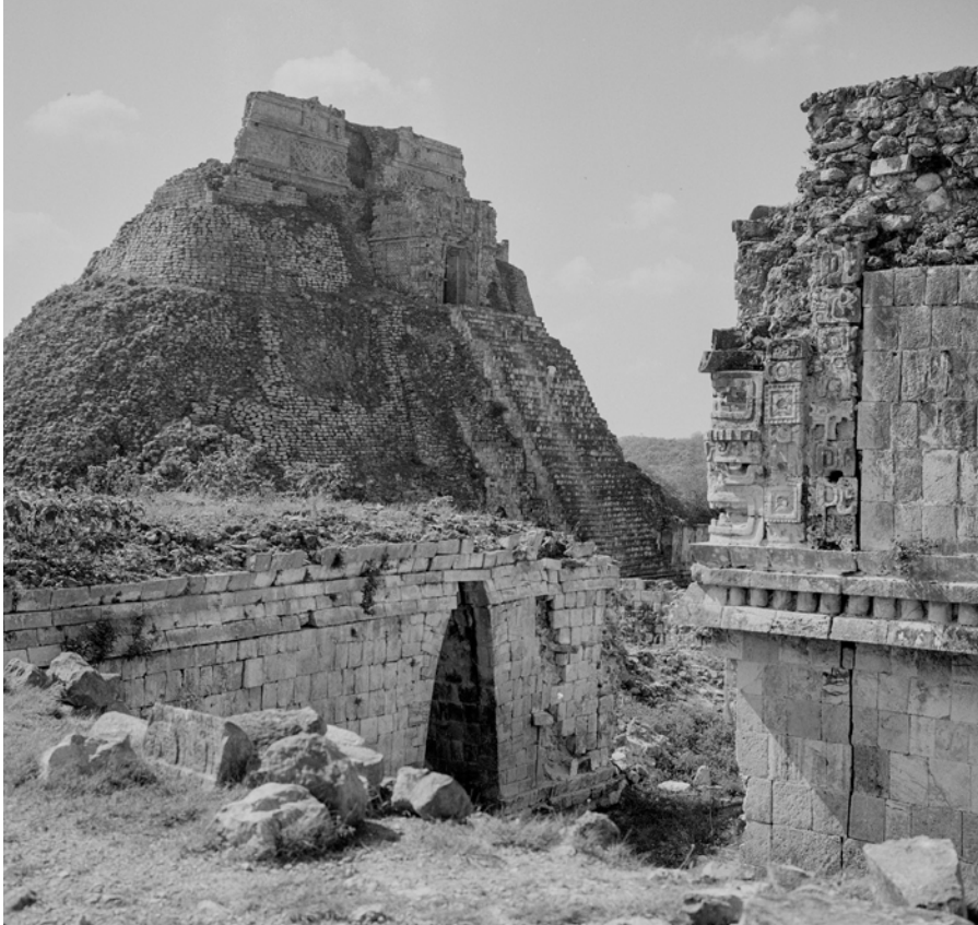
MÉXICO, YUCATÁN, UXMAL. Vista de la Pirámide del Adivino. Fotografía de Roberto Pane, 1962. Imagen: AFRP, AME2.N.37.

y la conquista de México; 1 éste es el precioso documento de una de las hazañas más legendarias de la historia. Tras la Conquista, el catolicismo, que se había extendido por Nueva España, destruyó las fuentes y los monumentos de las civilizaciones indígenas; pero ya en las ingenuas páginas que el viejo Bernal dedica a la memoria de su empresa juvenil, se intuye el inevitable destino que está a punto de cumplirse.