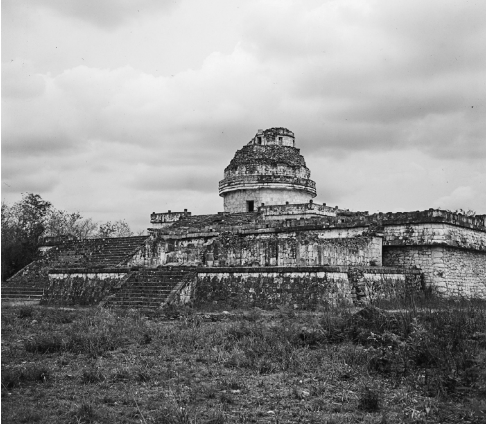
MÉXICO, YUCATÁN, CHICHÉN ITZÁ. El Caracol (Observatorio). Fotografía de Roberto Pane, 1962. Imagen: AFRP, AME2.P.30.

Como en esta sede no es posible más que reportar algunas impresiones y comentar algunas imágenes, me gustaría mencionar dos libros recientes de los que se puede obtener bastante información. Una revisión de toda la arquitectura precolombina de Mesoamérica es la publicada en inglés por Penguin, de la que es autor el profesor Kubler, de la Universidad de Yale; también hay numerosos estudios publicados en español por el Instituto Nacional de Antropología e Historia, pero una excelente síntesis, que recomiendo en especial para el conocimiento esencial de la arquitectura maya, es la escrita por el suizo Henri Stierlin: Architettura Maya , publicada en italiano por la editorial Il Parnaso.