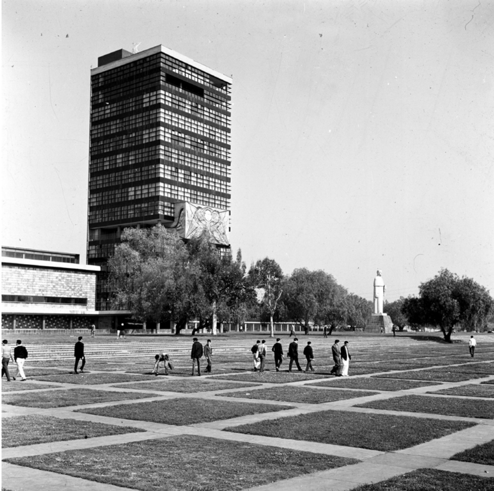
CIUDAD UNIVERSITARIA, UNAM. Fotografía de Roberto Pane, 1962. Imagen: AFRP, AME2.P.30.

Los ornamentos de mosaico que cubren algunos edificios—como el más famoso de la Biblioteca, con una inmensa pared, toda cubierta con motivos simbólicos que “estilizan” los antiguos signos ideográficos— me dejaron algo perplejo. A decir verdad, la pintura mexicana decepcionó en gran medida mis expectativas, tanto por su exagerado énfasis ideológico como por el gigantismo paroxístico que tan a menudo define su escala. De vez en cuando me acordaba de las colosales figuras de los dos obreros, en mosaico y relieve, basadas en un boceto de Diego Rivera; suscitando, por ésta y otras razones, una reserva de carácter psicológico—antes que estético—, me preguntaba si esas imágenes, exasperadas y rugientes, eran en realidad apropiadas para un ambiente destinado al estudio y a la búsqueda objetiva de la verdad.