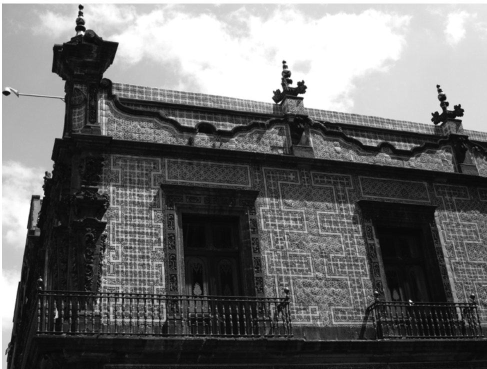
CASA DE LOS AZULEJOS, CIUDAD DE MÉXICO.

En el exterior de la catedral y en el fondo de muchos edificios hay un hermoso material rojizo, de origen volcánico, que a veces se utiliza en las fábricas modernas; es bastante similar a la “cruma” 5 de Pompeya, y contribuye a definir un aspecto distintivo del paisaje urbano.