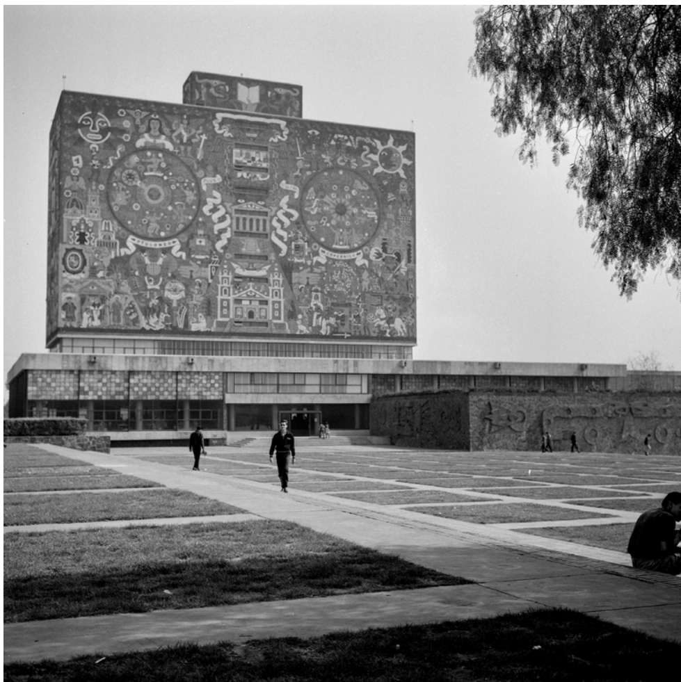
CIUDAD UNIVERSITARIA, UNAM, BIBLIOTECA. Fotografía de Roberto Pane, 1962. Imagen: AFRP, AME2.P.30.

de la producción andaluza actual. Y aquí puede resultar curioso añadir que, por otra parte, se hace un gran uso, en los edificios modernos, de los fantasiosos e insustanciales revestimientos de teselas de pasta de vidrio: una producción típica local que, de hecho, se denomina “mosaico italiano”.