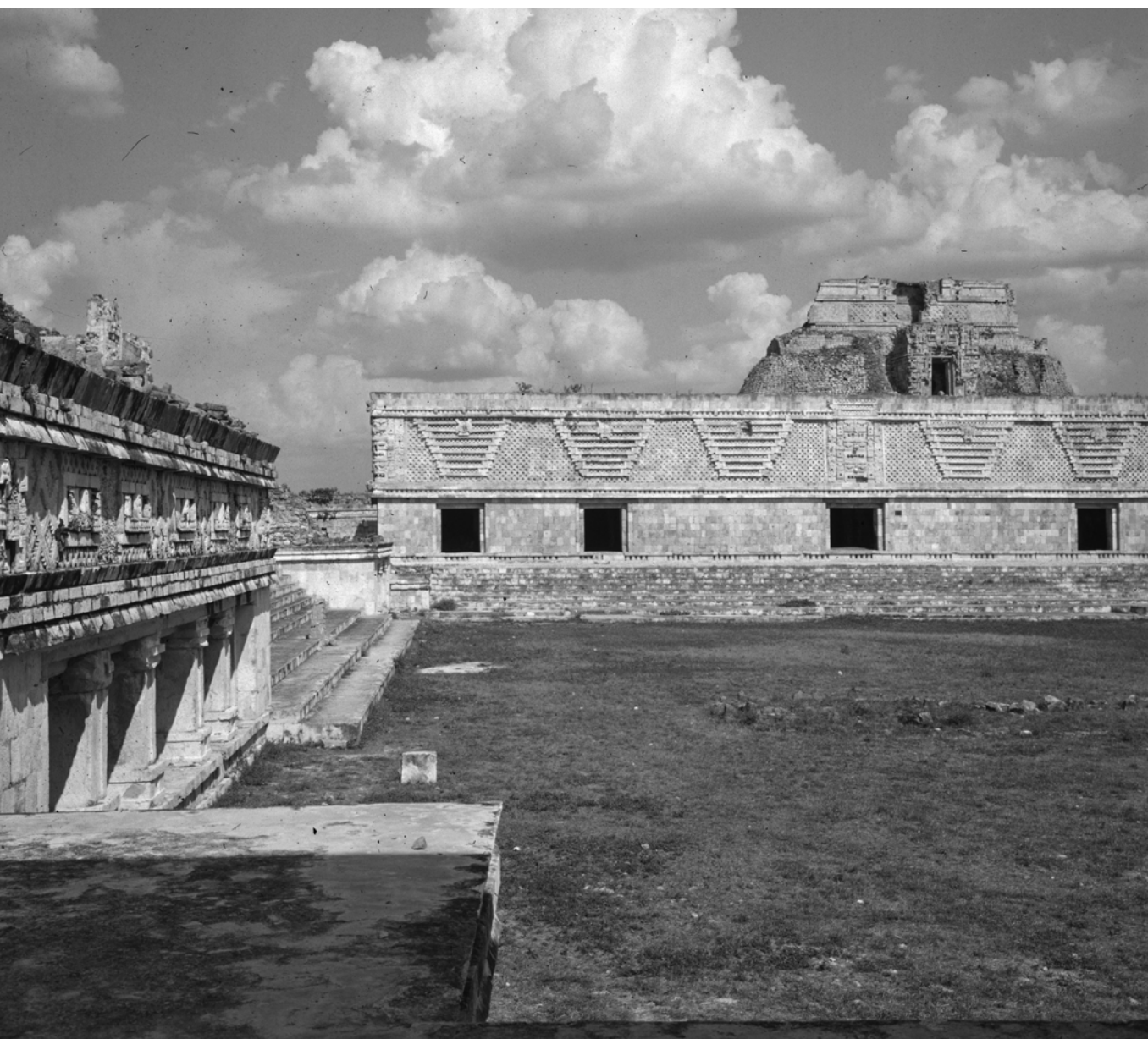
MÉXICO, YUCATÁN, UXMAL. Vista del Cuadrángulo de las Monjas.