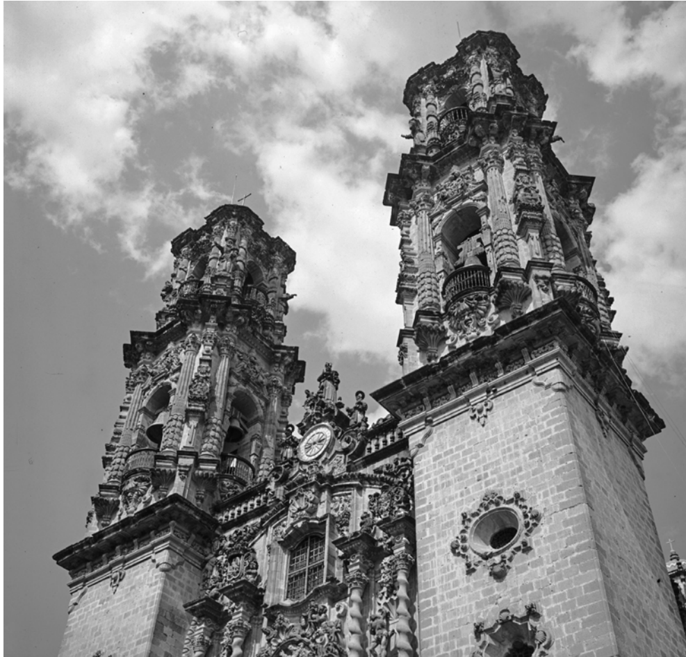
MÉXICO, TAXCO, SANTA PRISCA. Fotografía de Roberto Pane, 1962. Imagen: AFRP, AME2.P.31.

y artístico, en el marco de la naturaleza; algo muy parecido al entorno de Taos, en Nuevo México, que visité con verdadero disgusto hace una docena de años. En Taxco también hay una hermosa iglesia del siglo XVIII; ricamente estucada; fue levantada como un voto a la Virgen María, por un español que, más que ningún otro, había logrado hacer dinero extrayendo plata de las montañas con el trabajo de los indígenas.