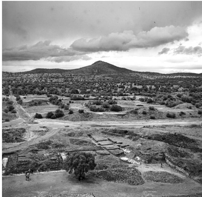
MÉXICO, TEOTIHUACÁN. Vista del paisaje en torno a la Pirámide del Sol. Fotografía de Roberto Pane, 1962. Imagen: AFRP, AME2.P.30.

Desde la cima de la Pirámide del Sol, fotografié el horizonte y luego, a mis pies, la estructura diagonal, marcada por las alineaciones de las piedras grises. La única imagen figurativa, tanto más contrastada con el entorno por la repetida secuencia de cabezas de serpiente, que sobresale en la ronda, es la pirámide de Quetzalcóatl, adosada en una más antigua. Y aquí hay que señalar que las fábricas construidas después de los cambios históricos radicales, producidos por éxodos, revoluciones y conquistas, se superponen o yuxtaponen con una brutalidad cuya evidencia aparece hoy quizás aún mayor que antes, debido al proceso de desintegración que descubre las estructuras a medida que los revestimientos ceden a la acción de los agentes externos.