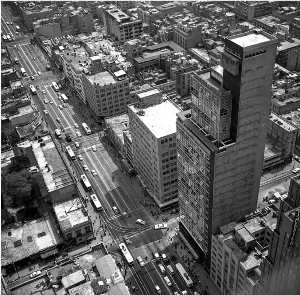
CIUDAD DE MÉXICO. Eje Central y Torre Latinoamericana. Fotografía de Roberto Pane, 1962. Imagen: AFRP, AME2.P.30.

El conjunto más notable, visto desde arriba, es el que corresponde a la plaza más grande a la que dan la catedral y el "Palacio Nacional". El espacio corresponde al del antiguo centro azteca sobre el que se levantaba el palacio de Moctezuma. Además, bajo los modernos edificios de la Ciudad de México, el antiguo trazado está presente con la misma continuidad compacta que en el subsuelo de Roma.