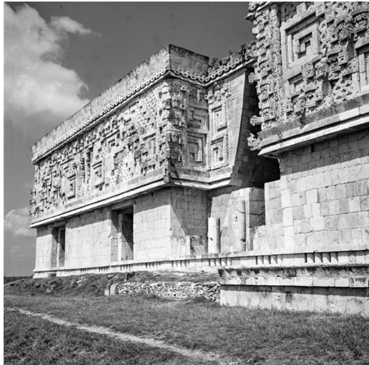
MÉXICO, YUCATÁN, UXMAL. Vista del Palacio del Gobernador. Fotografía de Roberto Pane, 1962. Imagen: AFRP, AME2.P.31.

En Uxmal se encuentra uno de los mayores edificios de la civilización maya, el llamado Palacio del Gobernador, del siglo VIII-IX: 98 metros de longitud, con 20 cámaras abovedadas y un friso escultórico que recorre toda la fachada; los dos nichos, correspondientes a las entradas principales, constituyen la única variación de ritmo, mientras que la escultura ininterrumpida del friso contrasta con los pilares lisos del basamento. El edificio, al que se accede por una amplia escalinata, domina el paisaje circundante, enmarcando perspectivas de gran efecto, en especial hacia la gran pirámide, conocida como la Pirámide del Adivino. Pero la mayor sorpresa la producen los efectos de clarooscuro de los relieves, en los que las máscaras estilizadas –un motivo siempre recurrente en esta arquitectura– se alternan con la geometría del fondo.