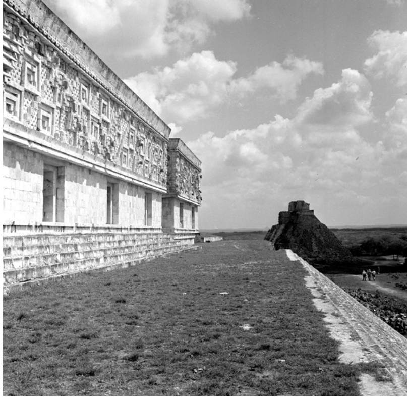
MÉXICO, YUCATÁN, UXMAL. Vista del Palacio del Gobernador. Fotografía de Roberto Pane, 1962. Imagen: AFRP, AME2.N.39.