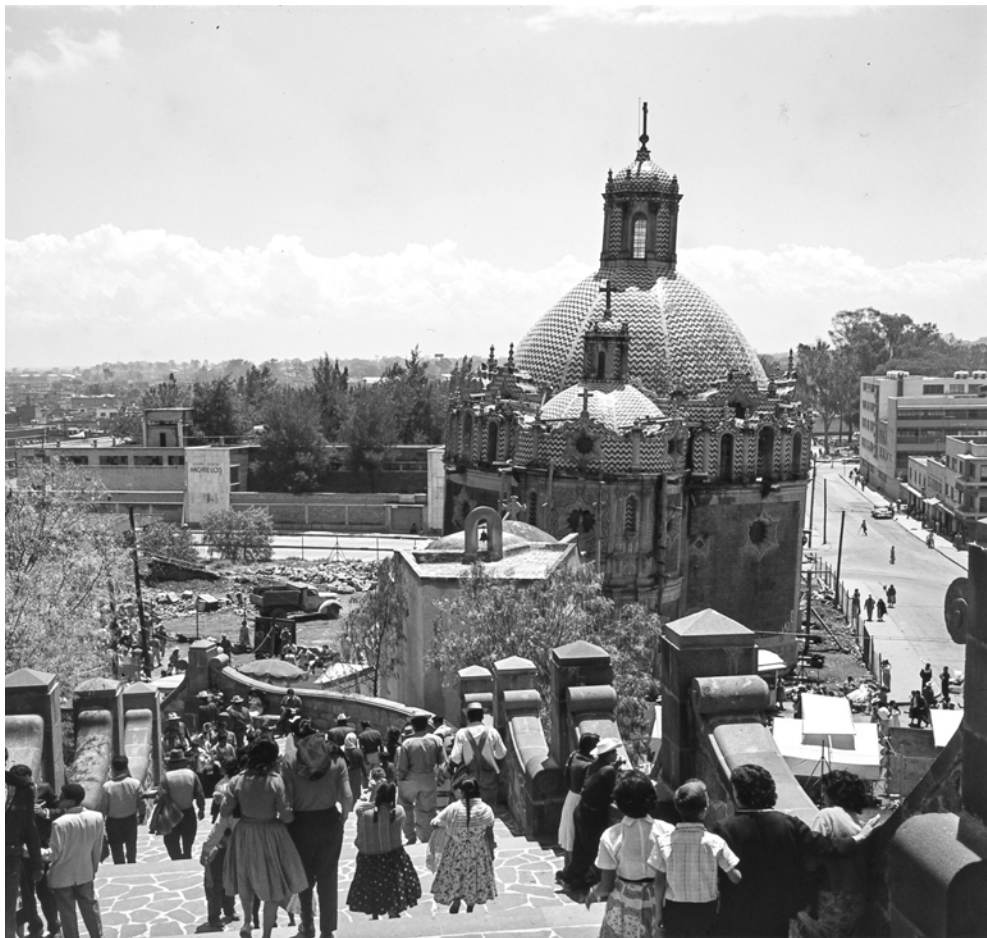
CIUDAD DE MÉXICO, CAPILLA DEL POCITO. Fotografía de Roberto Pane, 1962. Imagen: AFRP, AME2.P.31.

Otras numerosas diapositivas las dediqué a aspectos de la vida popular, en especial a los danzantes. Entre ellos, un niño me sorprendió por su parecido con el famoso guerrero de Palenque, la célebre cabeza de estuco que se expuso en Roma, hace años, junto con muchas esculturas preciosas de terracota y piedra: un verdadero tesoro de obras de arte que aún viaja por el mundo por iniciativa del gobierno mexicano. Pero igual debió llamarme la atención la similitud —e incluso diría la identidad somática— entre las esculturas mayas y los mayas modernos, a los que conocí en las pirámides de Yucatán.