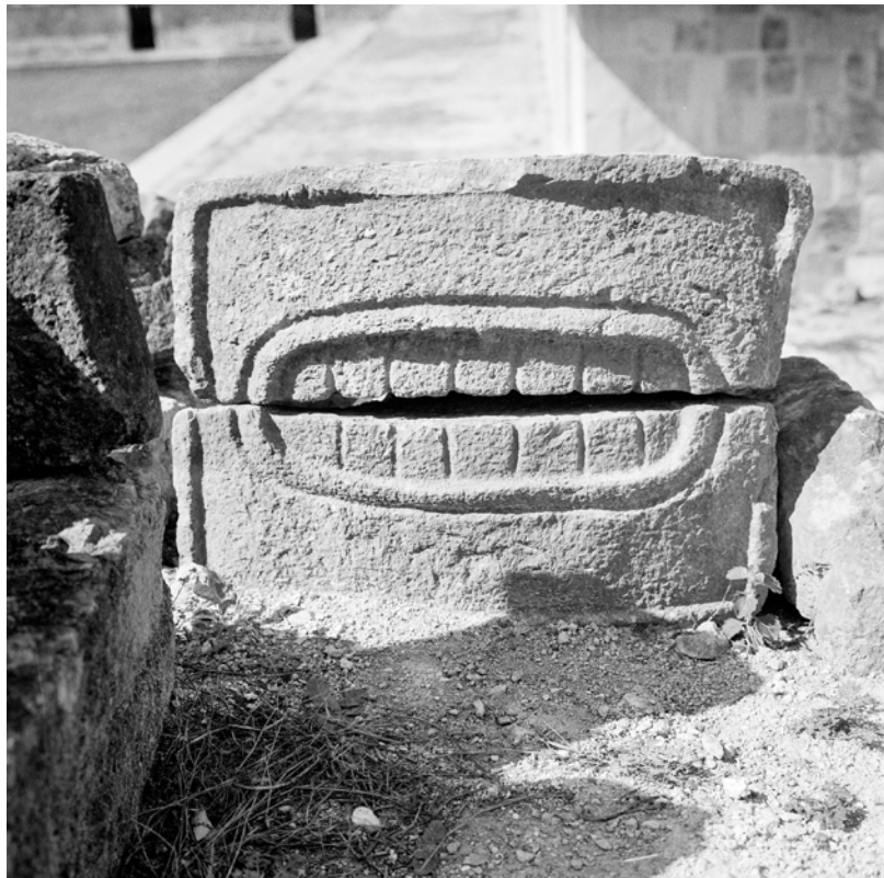
MÉXICO, YUCATÁN, UXMAL. Fragmento. Fotografía de Roberto Pane, 1962. Imagen: AFRP, AME2.N.40.