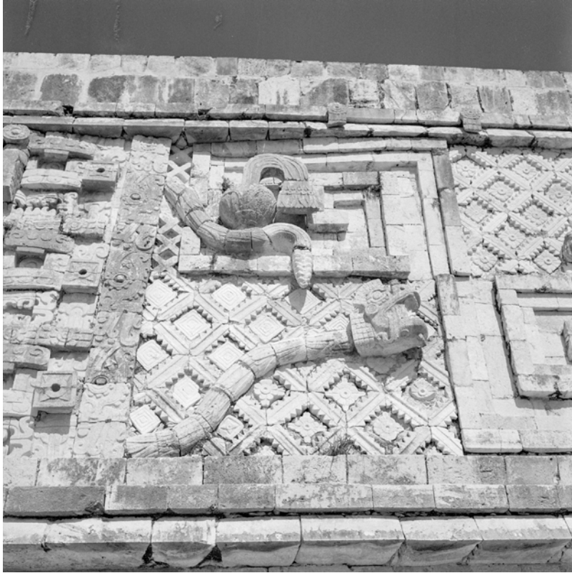
MÉXICO, YUCATÁN, UXMAL. Vista del Cuadrángulo de las Monjas, detalle del friso. Fotografía de Roberto Pane, 1962. Imagen: AFRP, AME2.N.38.