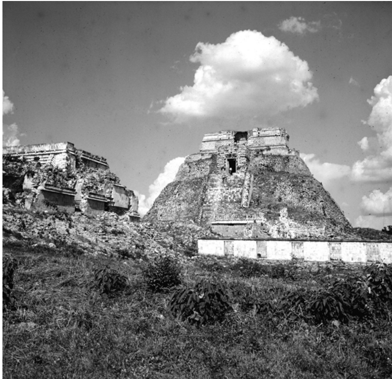
MÉXICO, YUCATÁN, UXMAL. Vista de la Pirámide del Adivino. Fotografía de Roberto Pane, 1962. Imagen: AFRP, AME2.P.31.