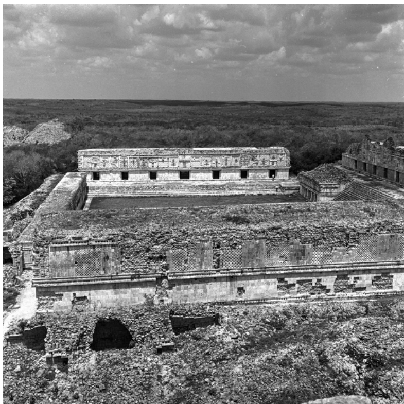
MESSICO, YUCATAN, UXMAL. Veduta del Quadrilatero delle Monache. Fotografia di Roberto Pane, 1962. Immagine: AFRP, AME2.P.30.

Forse la più grandiosa testimonianza, in tutto lo Yucatán, è quella che offre, anche a Uxmal, l'interno del cosiddetto quadrilatero delle Monache: un vero e proprio teatro religioso, formato da un vastissimo cortile, tra quattro edifici ed ampie gradinate frontali. Qui un grande serpente piumato raccoglie tutta la decorazione della fonte più rappresentativa e segna una importante variazione rispetto ai rilievi del palazzo del Governatore, per il più accentuato chiaroscuro di alcune statue a tutto tondo. Ma, a questo punto, indulgendo a quel bisogno di confronto che immancabilmente si riaffaccia in noi, sempre che ci troviamo alla presenza di immagini del tutto nuove, debbo dire che la scultura maya ha rinnovato in me il ricordo di quella romanica: certamente la sola che, nella civiltà europea, fornisca un'analogia con il gusto formale dei rilievi dello Yucatán; entrambe infatti sono assai ricche di variazioni chiaroscurali pur nella costante subordinazione ad un registro tonale; ma nel romanico, l'elemento naturalistico e descrittivo prevale su ogni scansione geometrica, riducendola talvolta ad un'approssimazione, tanto più vitale in quanto è, appunto, ingenua immagine della natura. Nei rilievi maya, invece, la geometria è ricorrenza costante, simbolo coerente della matematica dei movimenti astrali. Non per nulla questa è la scultura del popolo che ha, più di ogni altro dell'antichità, conosciuto l'astronomia.