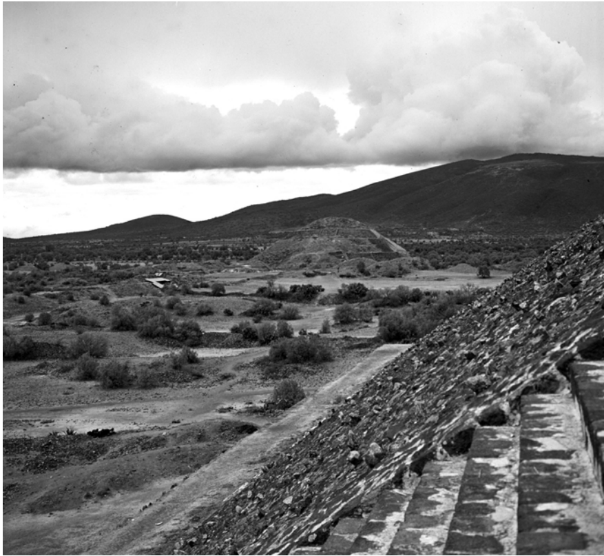
MESSICO, TEOTIHUACAN. Veduta dalla Piramide del Sole. Fotografia di Roberto Pane, 1962. Immagine: AFRP, AME2.P.30.