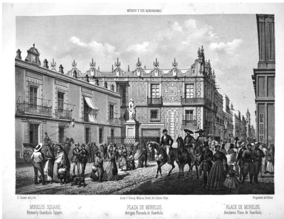
CASA DE LOS AZULEJOS, CITTÀ DEL MESSICO, 1858.

Osservando da vicino la “plaza nacional”, detta lo Zòcalo, riconosciamo l’impronta spagnola e churrigueresca della cattedrale, nel ridondante ed esasperato chiaroscuro esterno, privo –come sempre il barocco iberico– di quella scansione degli ordini, che è costante impegno di visibilità e di ritmo nel barocco italiano.