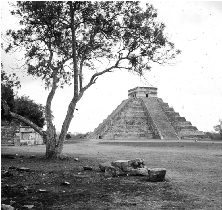
MESSICO, YUCATAN, CHICHÉN ITZÁ. Piramide di Kukulcan detta "El Castillo". Fotografia di Roberto Pane, 1962. Immagine: AFRP, AME2.P.30.

Non essendo possibile altro, in questa sede, che riferire qualche impressione e commentare alcune immagini, tengo a ricordare due libri recenti dai quali si potrà attingere una informazione abbastanza vasta. Una rassegna di tutta l'architettura precolombiana della Meso America è quella pubblicata in inglese della editrice Penguin, autore il prof. Kubler, dell'Università di Yale; vi sono poi numerosissimi studi, editi in castigliano, a cura dell'Istituto messicano di antropologia e storia, Ma, un'ottima sintesi, che raccomando a voi in modo particolare, per una conoscenza essenziale dell'architettura maya, è quella redatta dallo svizzero Henri Stierlin: Architettura Maya , pubblicata in italiano dall'editore "Il Parnaso".