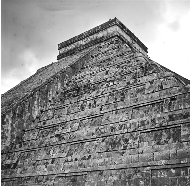
MESSICO, YUCATAN, CHICHÉN ITZÀ. Piramide di Kukulcan detta "El Castillo". Fotografia di Roberto Pane, 1962. Immagine: AFRP, AME2.P.30.

Messico ; questo è il documento prezioso di una delle più leggendarie imprese della storia. In seguito alla conquista, il cattolicesimo, diffuso nella Nueva España, distruggerà le fonti e i monumenti delle civiltà indigene; ma già nelle ingenue pagine che il vecchio Bernal dedica al ricordo dell'impresa giovanile, si sente l'inevitabile destino che sta per compiersi.