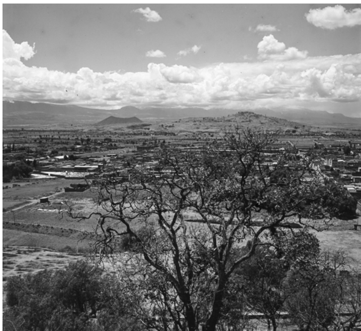
MESSICO, PAESAGGIO INTORNO A TEOTIHUACÁN. Fotografia di Roberto Pane, 1962. Immagine: AFRP, AME2.P.31.

Vero è che l'università del Messico è stata costruita tutta in tre anni –quasi come si fanno oggi i grandi complessi delle mostre internazionali– e quindi la sua stessa visione unitaria è destinata, tenuto conto del continuo rinnovarsi delle funzioni, a subire sostanziali rifacimenti. Ho visitato in particolare la scuola d'architettura, presso la quale è stato organizzato un interessante museo archeologico del Messico precolombiano, con plastici e rilievi allestiti dagli studenti. Ma la Biblioteca era singolarmente deficitaria, e ciò, purtroppo, non può non essere assunto come indizio per un giudizio negativo circa la qualità, ed il livello dei corsi.