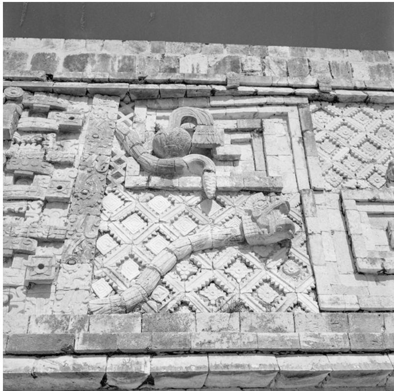
MESSICO, YUCATAN, UXMAL. Veduta del Quadrilatero delle Monache, particolare del fregio. Fotografia di Roberto Pane, 1962. Immagine: AFRP, AME2.N.38.