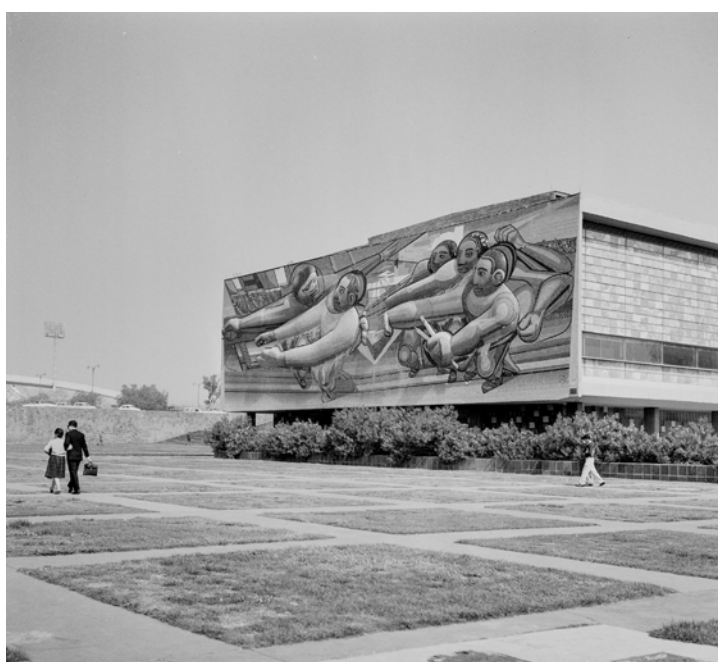
CITTÀ DEL MESSICO, UNIVERSITÀ UNAM. Fotografia di Roberto Pane, 1962. Immagine: AFRP, AME2.P.30.

Vero è che l'università del Messico è stata costruita tutta in tre anni –quasi come si fanno oggi i grandi complessi delle mostre internazionali– e quindi la sua stessa visione unitaria è destinata, tenuto conto del continuo rinnovarsi delle funzioni, a subire sostanziali rifacimenti. Ho visitato in particolare la scuola d'architettura, presso la quale è stato organizzato un interessante museo archeologico del Messico precolombiano, con plastici e rilievi allestiti dagli studenti. Ma la Biblioteca era singolarmente deficitaria, e ciò, purtroppo, non può non essere assunto come indizio per un giudizio negativo circa la qualità, ed il livello dei corsi.