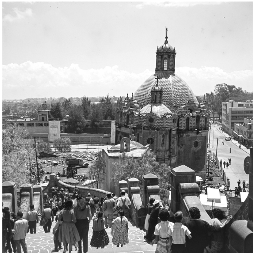
CITTÀ DEL MESSICO, CAPPELLA EL POCITO. Fotografia di Roberto Pane, 1962. Immagine: AFRP, AME2.P31.

Presso la grande ma non pregevole chiesa di Guadalupe sorge uno dei monumenti più notevoli del Messico: la cappella della Fontana, con cupola rivestita di maioliche bianche e azzurre; ma anche questo, purtroppo, è un edificio più o meno gravemente dissestato per le ragioni già, accennate; ed anche qui, al tempo della mia visita, erano in corso complessi lavori di restauro.