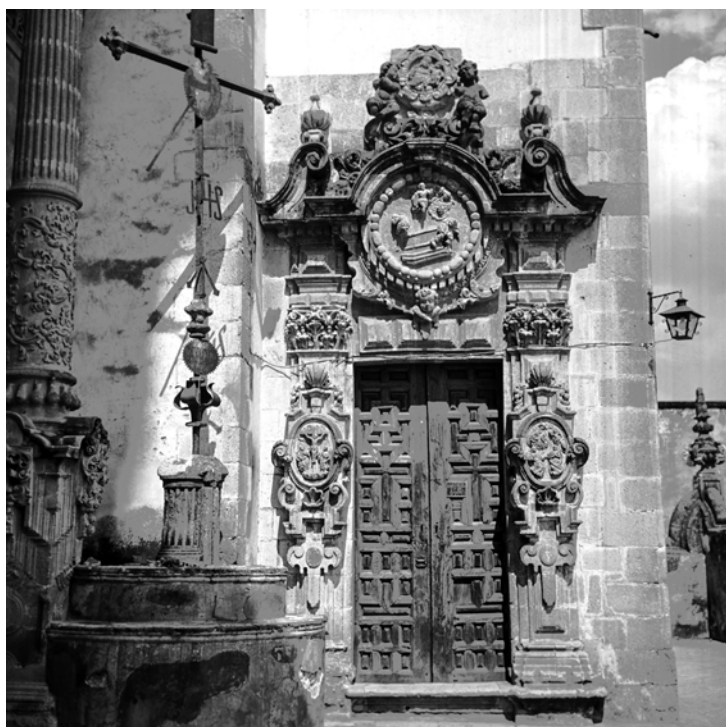
MESSICO, TAXCO, SANTA PRISCA. Fotografia di Roberto Pane, 1962. Immagine: AFRP, AME2.P.31

Le guide parlano di Taxco come di un luogo incantevole; probabilmente lo era, ma oggi è dominato da quella tipica leziosaggine che ha reso edulcorati e stucchevoli i luoghi più celebrati del turismo europeo. Qui si sente il finto isolamento contemplativo ed artistico, nel quadro della natura; qualcosa di molto simile all'ambiente di Taos, nel nuovo Messico, che ho visitato con vero disgusto una dozzina di anni fa. A Taxco è anche una bella chiesa settecentesca; ricca di stucchi; essa fu elevata per voto alla Madonna, da uno spagnolo che più di ogni altro era riuscito a far denaro, cavando argento-dalle montagne con la fatica degli indigeni.