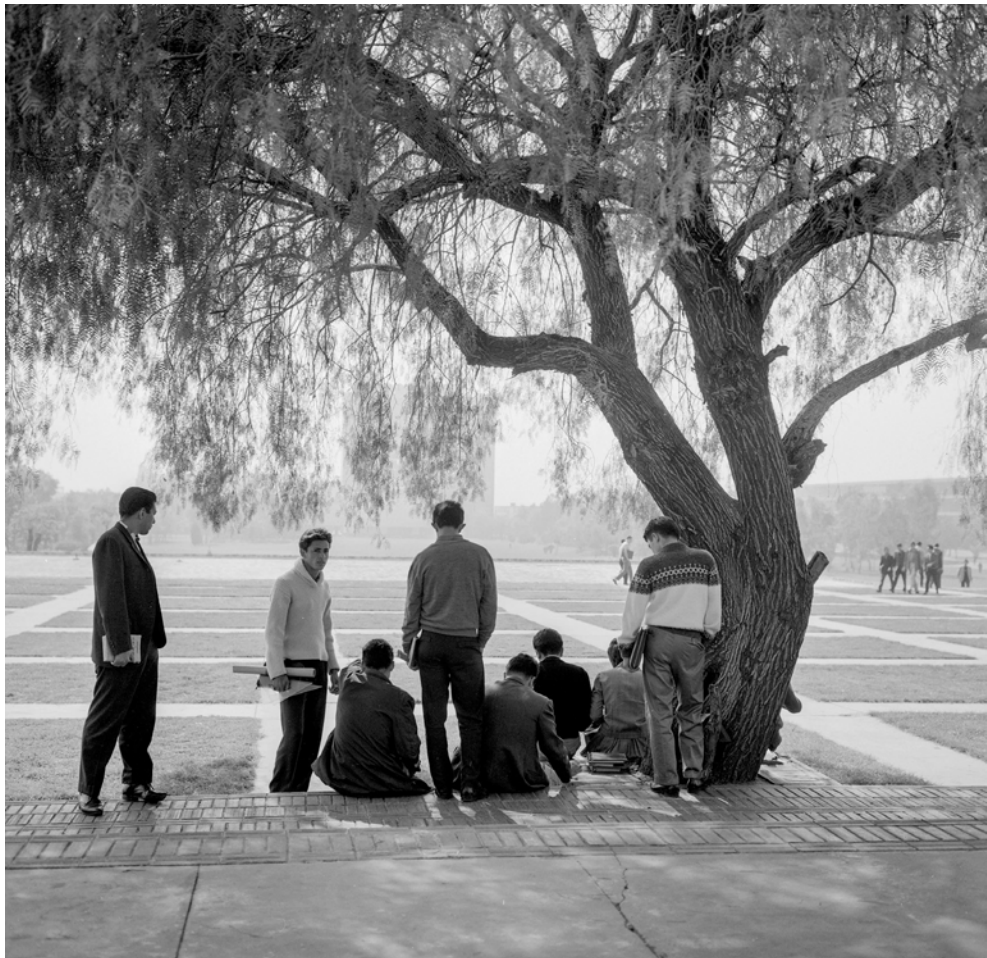
CITTÀ DEL MESSICO, UNIVERSITÀ UNAM.

Gli ornati in mosaico, che rivestono alcuni edifici –quale ad esempio quello più noto della Biblioteca, con una immensa parete tutta rivestita di motivi simbolici che “stilizzano” antichi segni ideografici– mi hanno lasciato alquanto perplesso. Se devo dire la verità, la pittura messicana ha gran parte deluso la mia aspettativa, sia per la sua esasperata enfasi ideologica sia per il gigantismo parossistico che così spesso ne definisce la scala. Ogni tanto mi sono tornate in mente le figure colossali dei due operai, in mosaico ed a rilievo, su cartone di Diego Rivera; sollevando, per questo e per altro una riserva di natura psicologica –prima che estetica–, mi sono chiesto se davvero simili immagini, esasperate ed urlanti, fossero consone ad un ambiente destinato allo studio ed alla obiettiva ricerca della verità.