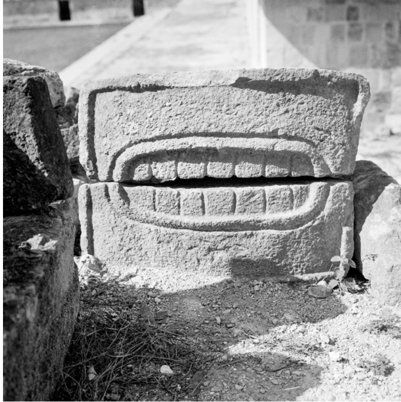
MESSICO, YUCATAN, UXMAL. Frammento. Fotografia di Roberto Pane, 1962. Immagine: AFRP, AME2.N.40.