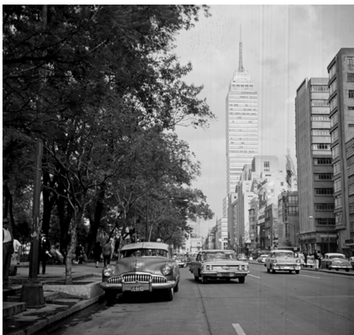
CITTÀ DEL MESSICO. Asse Centrale e Torre Latino America. Fotografia di Roberto Pane, 1962. Immagine: AFRP, AME2.P.30.

Prima di dare uno sguardo a Città del Messico, osserviamo un curioso disegno: una specie di sigillo araldico, inviato da Cortés a Carlo V, per spiegargli la struttura urbanistica della capitale azteca. Essa si presentava come una città lagunare, una specie di Venezia distesa su un altipiano, a quota duemilatrecento circa, al centro dell'isola Tenochtitlán 1 . Il disegno mostra la grande piazza con la piramide sulla quale venivano compiuti i sacrifici umani. La ferocia del culto azteco, era, già da allora, posta in evidenza per giustificare le repressioni e le distruzioni operate dai conquistatori. Ma, per quante generazioni la Spagna doveva, con la sua Inquisizione, esercitare sacrifici umani in nome di Cristo?