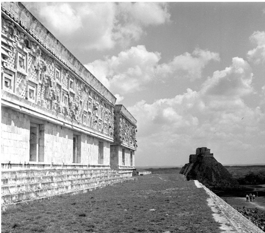
MESSICO, YUCATAN, UXMAL. Veduta del Palazzo del Governatore. Fotografia di Roberto Pane, 1962. Immagine: AFRP, AME2.N.39.