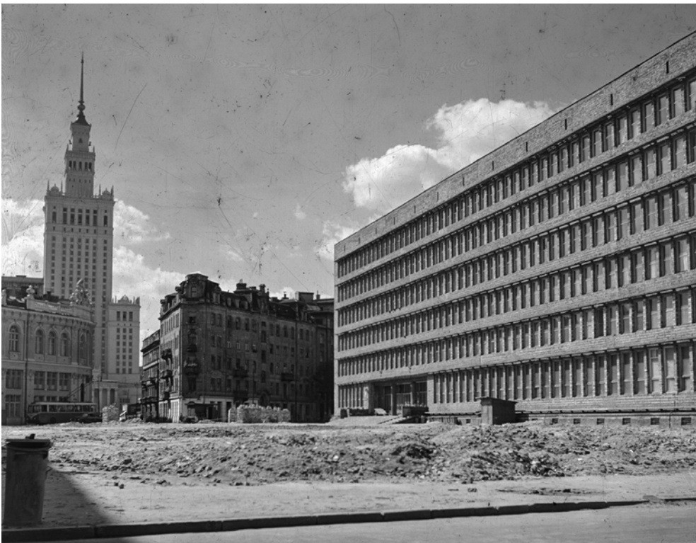
VARSAVIA. Nuovi edifici nelle aree danneggiate dalla guerra e sullo sfondo il palazzo della cultura (Pałac Kultury i Nauki) "dono dell'URSS". Immagine: Roberto Pane, 1957 (AFRP, POL.N.6).