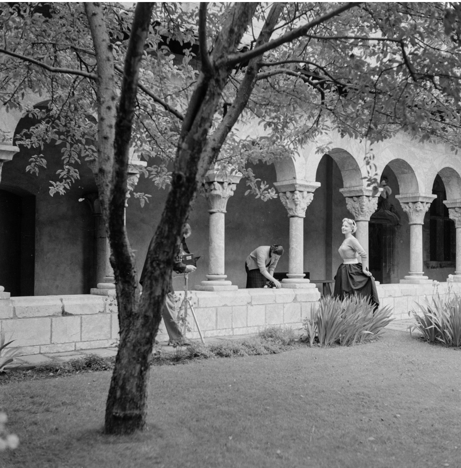
NEW YORK. Fort Tryon Park, complesso "The MET Cloisters". Immagine: Roberto Pane, 1953 (AFRP, AME.N.25).