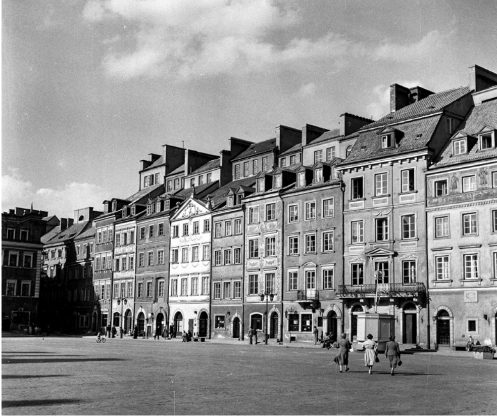
VARSAVIA. Scorci dello Stare Miasto (centro storico) dopo i restauri. Immagine: Roberto Pane, 1957 (AFRP, POL.N.15).