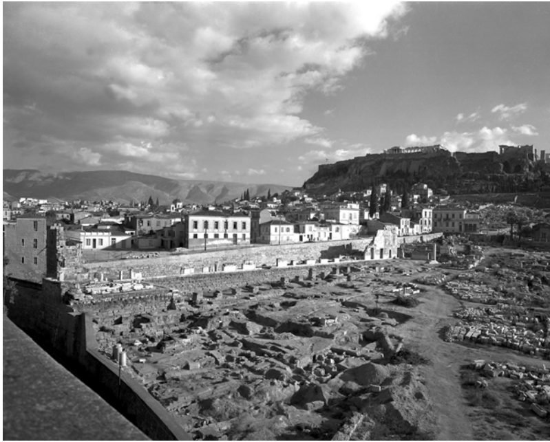
ATENE. Stoà di Attalo prima della ricostruzione, 1952. Immagine: American School of Classical Studies at Athens, Agora Excavations.

replicava dicendo che la mia concezione del restauro e della conservazione era troppo rigida, e che i Cloisters costituivano un efficace esempio di medioevo europeo per tanti americani che non potevano concedersi il lusso di visitarlo in loco . Si direbbe, dunque, che l'intransigenza culturale possa persino essere interpretata come una insufficienza di spirito democratico; ed è evidente che, per tal via, l'immagine del monumento possa farsi espressione e simbolo di più vasti significati.