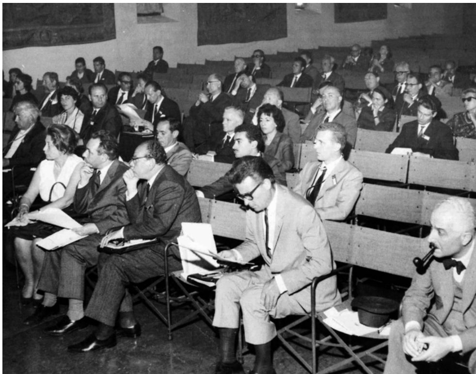
VENEZIA. Lavori del II Congresso Internazionale del Restauro, 25-31 maggio 1964.