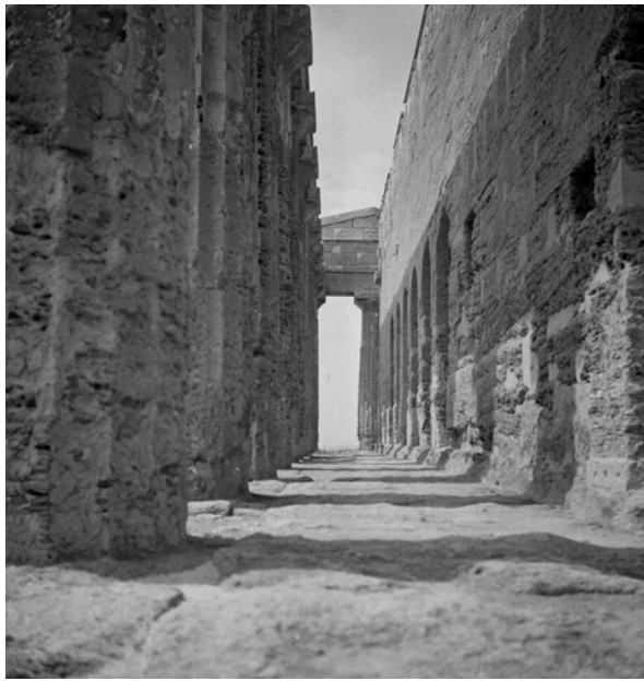
AGRIGENTO. Tempio della Concordia. Immagine: Roberto Pane, anni 1950-60 (AFRP, SIC.N.30).

stesso può dirsi per tanti illustri edifici la cui storia artistica non può tacere, se vuole esser completa, dei sostanziali rifacimenti che sono stati compiuti già in un passato abbastanza lontano, affinché il loro volto primitivo potesse continuare a sussistere. E del resto, anche in condizioni di più favorevole temperie, la conservazione di una più remota antichità ha motivato tutta una serie di successive sostituzioni; così il tempio della Concordia ad Agrigento mostra una sua storia moderna nei segni dei diversi restauri che vi sono stati apportati da oltre duecento anni a questa parte; anzi si può dire che proprio per questo esso fornisca una curiosa, seppur deludente, documentazione storica dei diversi metodi seguiti per assicurare la conservazione del monumento, mentre all'occhio del profano esso sembra fornire l'esempio di una eccezionale sopravvivenza.