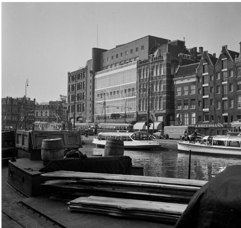
AMSTERDAM. Case vecchie e nuove. Immagine: Roberto Pane, fine anni 1940 (AFRP, OLA.N.4).