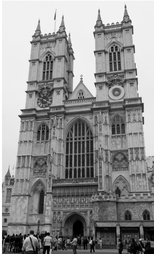
ABBAZIA DI WESTMINSTER, LONDRA.

Ma ciò che nella tesi della intransigenza appare francamente assurdo è il volere, come ho accennato, ignorare la evidente realtà storica della stratificazione che si è compiuta nel passato, configurando, con i suoi contrasti, l'ambiente che desideriamo salvare, ed il negare che altrettanto possa e debba avvenire anche nel presente. L'inserimento di forme nuove nella città antica non potrebbe non aver luogo anche se le norme di tutela ed il più rigoroso rispetto venissero osservati. Ma perché questo avvenga nel modo migliore è necessario che l'ambiente sia sentito come un'opera collettiva da salvare in quanto tale; e cioè non come integrale conservazione di una somma di particolari, secondo che si intende la conservazione di una fabbrica singola, ma come rapporto di masse e di spazi che consenta la sostituzione di un edificio antico con uno nuovo purchè esso sia subordinato al rapporto suddetto.