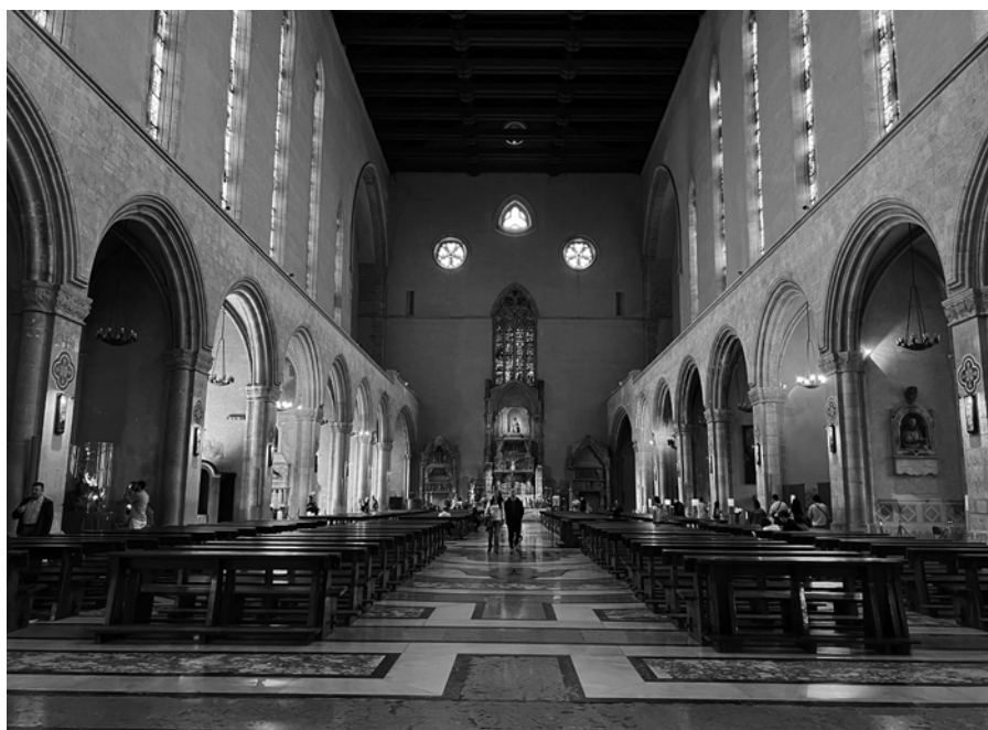
SANTA CHIARA. Interior en la actualidad. Imagen: Valerie Magar, 2023.

Con estas consideraciones, pretendía aclarar y, en cierto modo, llevar hasta sus últimas consecuencias estéticas los dictados de los conceptos más modernos de la restauración.