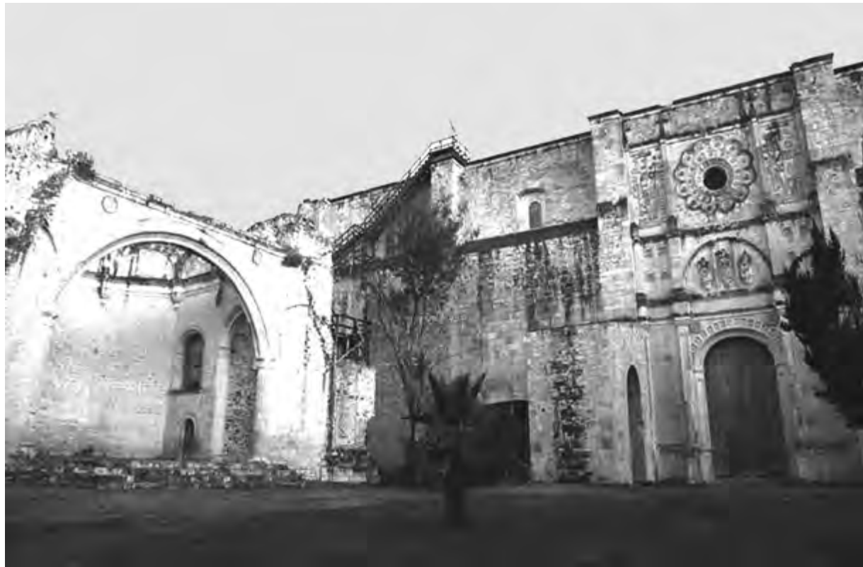
CONVENTO DE SAN JUAN BAUTISTA DE COIXTLAHUACA, OAXACA

Por último, considero que el principio de mínima intervención deberá consistir en lograr la conservación integral del objeto con el menor número de tratamientos necesarios para ello y la menor cantidad de productos posibles, los cuales a su vez deberán garantizar, durante los procesos que se realicen, el respeto a los valores del bien cultural (principio de prudencia). Se debe renunciar a toda participación creadora, y otorgar relevancia al respeto del autor y de la historia del bien. El principio de mínima intervención no es un objetivo en sí mismo; éste deberá quedar incluido durante la formulación del proyecto, para buscar las soluciones menos invasivas que permitan atender los objetivos planteados.