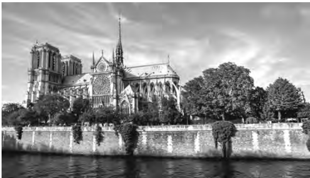
FIGURA 4. CATEDRAL DE NOTRE-DAME DE PARÍS EN LA ACTUALIDAD.