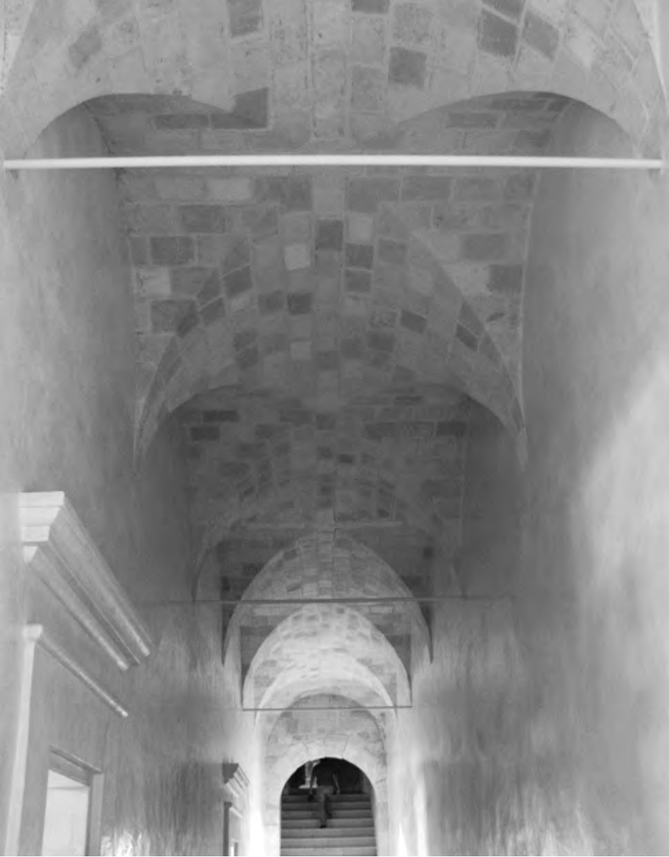
FIGURAS 5 Y 6. TEMPLO DE COIXTLAHUACA Planta baja y planta alta, reposición de bóvedas.