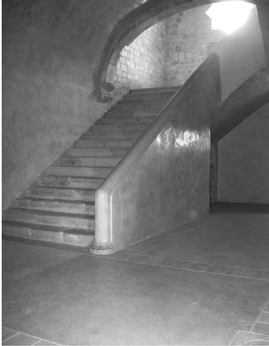
FIGURAS 7 Y 8. TEMPLO DE COIXTLAHUACA Reconstrucción de los espacios y elementos arquitectónicos no documentados.