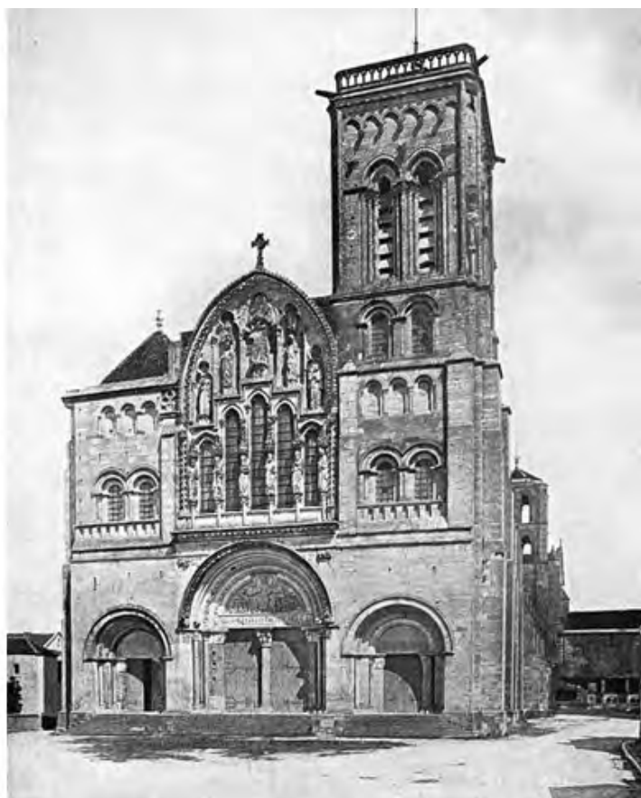
FIGURA 2. SAINTE - MADELEINE VÉZELAY DESPUÉS DE LA RESTAURACIÓN POR VIOLLET-LE-DUC