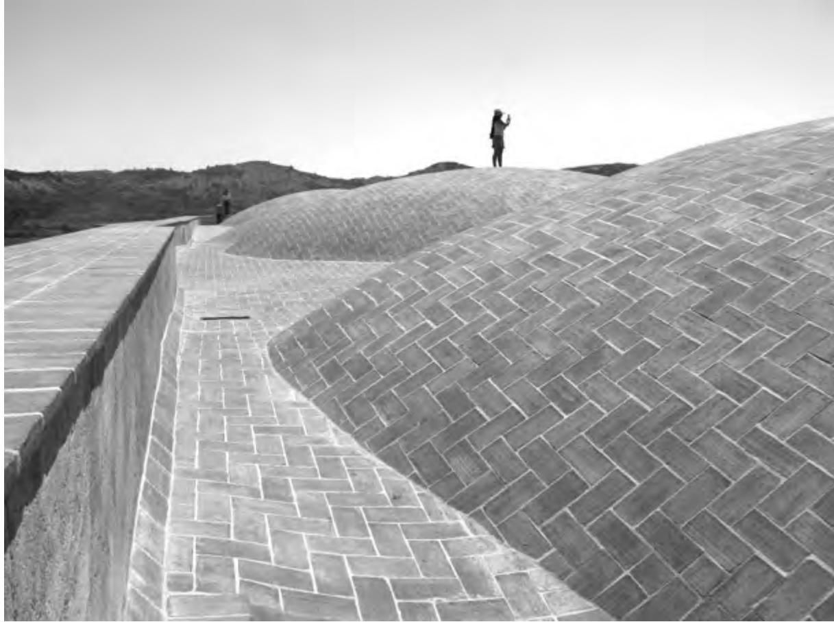
FIGURAS 9 Y 10. TEMPLO DE COIXTLAHUACA. Reconstrucción no documentada de las cubiertas y el interior del claustro.