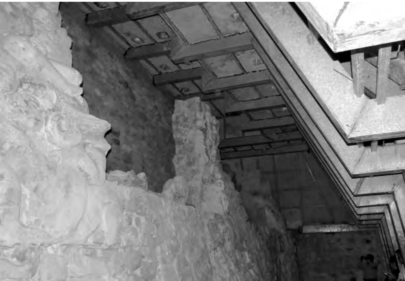
FIGURA 11. BALAM KU Oxidación de los elementos de la cubierta del friso en la zona arqueológica

A pesar de ciertas bondades que tiene el uso de metales en la actualidad, para el refuerzo de estructuras antiguas de carácter histórico o arqueológico, en mi opinión es imprescindible siempre tener en mente que son muy vulnerables en ambientes húmedos. En México existen muchas zonas de monumentos que se encuentran en climas tropicales húmedos; tal es el caso del sureste del país. Por otro lado, en ocasiones de manera irreflexiva, se han utilizado estructuras metálicas como cubiertas de protección de ciertos elementos arqueológicos o como elementos de soporte. Aunque puede tratarse de conceptos innovadores en algunos casos, se ha comprobado la vulnerabilidad de los metales ante los efectos del agua ya sea por filtración, condensación o capilaridad.