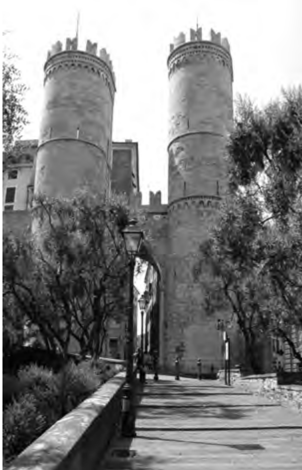
FIGURA 5. GENOVA, LE TORRI DI PORTA SOPRANA, RESTAURATE DA ALFREDO D'ANDRADE.