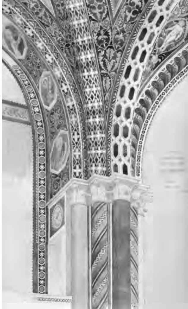
FIGURA 4. VIOLLET-LE-DUC, L'IMPOSTA DELLE VOLTE NELLA CHIESA SUPERIORE DI SAN FRANCESCO AD ASSISI