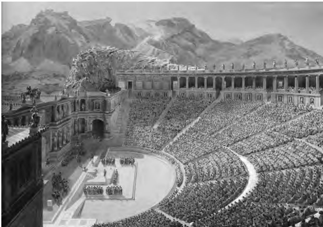
FIGURA 2. VIOLLET-LE-DUC, LA RICOSTRUZIONE DEL TEATRO DI TAORMINA (PARTICOLARE)

A confronto con la ricezione della classicità, lo sguardo rivolto agli edifici del medioevo si sofferma su aspetti decorativi più che strutturali e si appoggia ancora a categorie storiografiche malferme –ad esempio nella dilatazione del significato di byzantin – tuttavia condivise con la cultura dell'epoca. Viollet percepisce con attenzione la policromia del S. Francesco di Assisi (Figura 3) o del Duomo di Siena (Figura 4), così come l'uso dei materiali nel S. Lorenzo a Genova, le variazioni chiaroscurali nel chiostro di S. Giovanni in Laterano a Roma, i rivestimenti marmorei di S. Maria del Fiore a Firenze, o infine la ricchezza del soffitto della cattedrale di Messina, ispirato a modelli arabi. Ma l'impressione suscitata dai monumenti italiani è profonda: la facciata del palazzo Ducale a Venezia, nell'inversione dei tradizionali rapporti tra pieni e vuoti, viene reinterpretata a distanza di decenni negli Entretiens come «s'il était élevé en bois», confermando così la predilezione per una concezione architettonica basata sull'equilibrio delle spinte, più che sulla statica gravità.