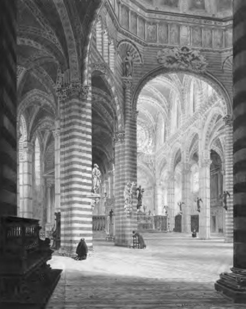
FIGURA 3. VIOLLET-LE-DUC, SIENA, L'INTERNO DELLA CATTEDRALE