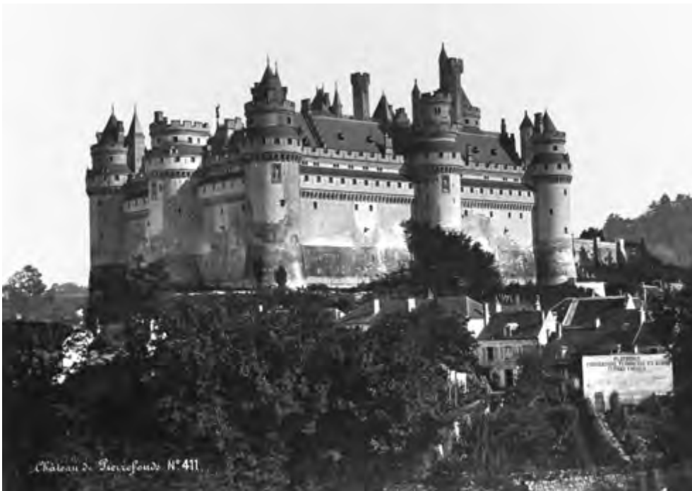
CASTILLO DE PIERREFONDS RESTAURADO. Postal.