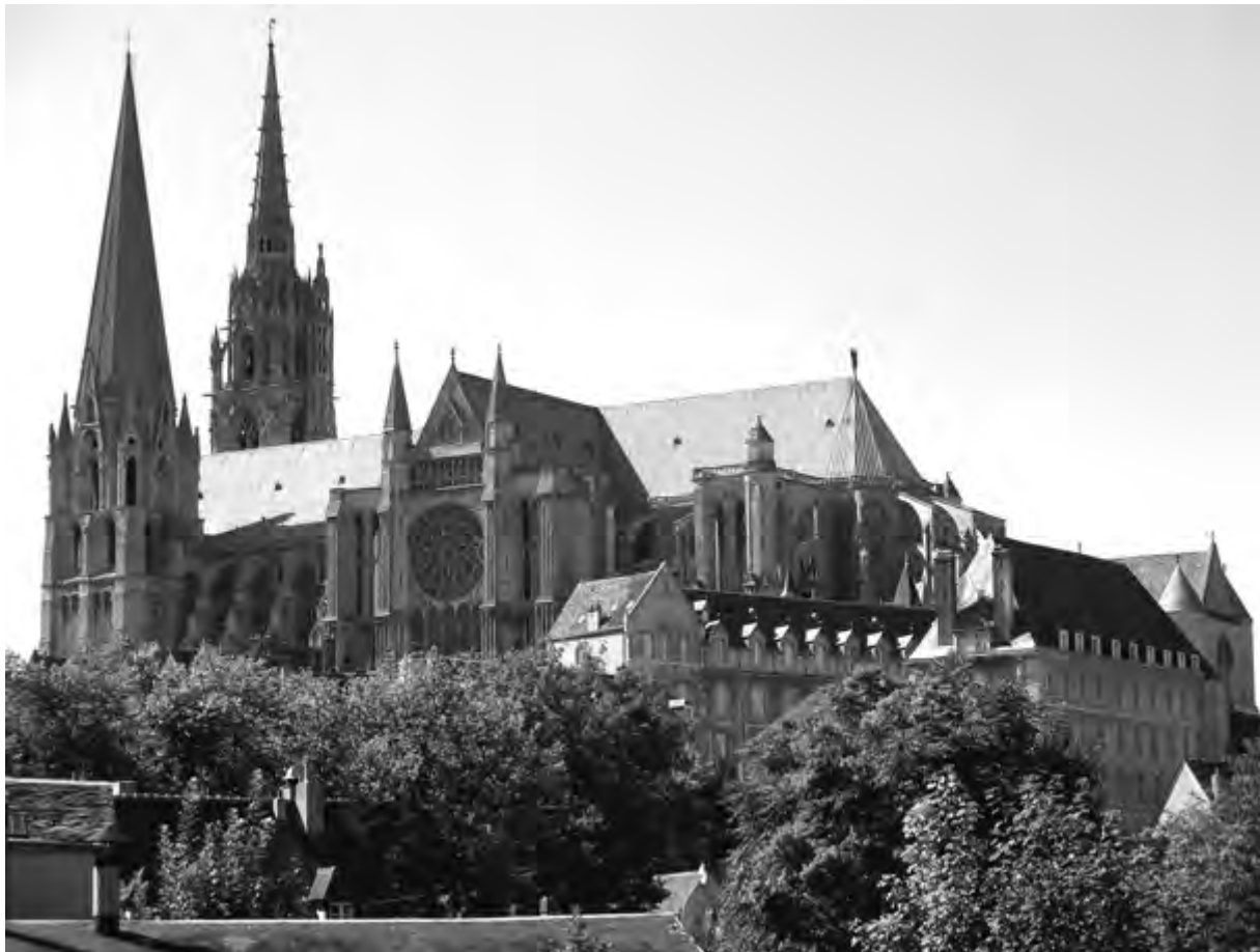
CATEDRAL DE CHARTRES