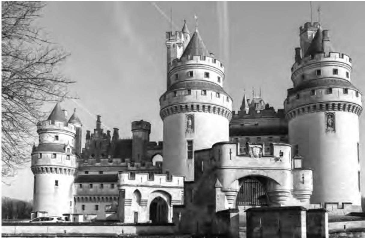
CASTILLO DE PIERREFONDS. Imagen: Valerie Magar