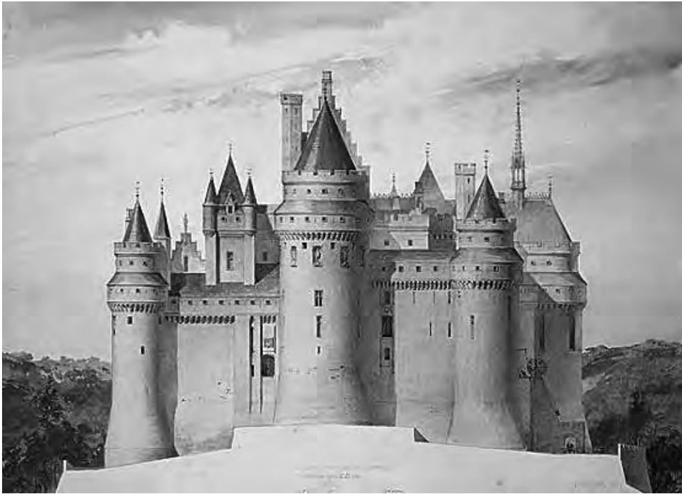
CASTILLO DE PIERREFONDS POR VIOLETT-LE-DUC. Acuarela, 1858.