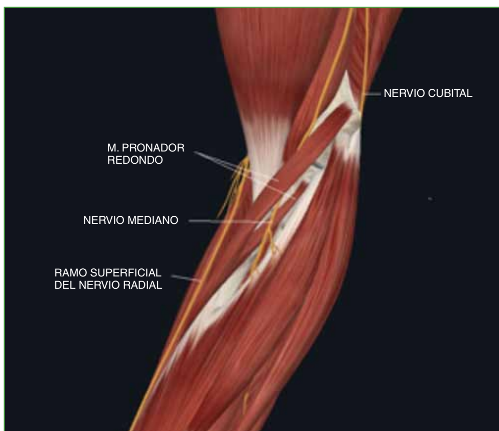
Figura 3. Nervio mediano en su trayecto entre las dos cabezas del músculo pronador redondo. Fuente: Atlas interactivo Complete Anatomy , versión 10.0.1, modificada.

Se estableció el diagnóstico principal de SPR en el contexto de un síndrome del túnel carpiano y una neuropatía del nervio cubital a nivel del codo y se indicó reposo funcional evitando movimientos de pronosupinación repetitivos, descanso de su actividad musical, tratamiento fisioterapéutico mediante masoterapia, electroterapia y estiramientos, corticoides (deflazacort 30 mg/día, por vía oral, durante 5 días, en pauta descendente durante 20 días) y la toma diaria de un complejo vitamínico B combinado con ácido alfa-lipoico durante 2 meses.