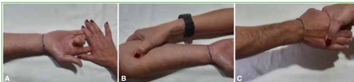
Figura 1. Pruebas exploratorias en el síndrome del pronador redondo. A. Prueba del flexor superficial de los dedos. B. Prueba de la presión. C. Prueba de la supinación resistida.

En la exploración funcional del raquis cervical, no se detectaron contracturas de la musculatura, dolor a la palpación apofisaria, ni limitación de la movilidad. Las pruebas de elongación radicular intensificaban los síntomas sensitivos en la cara anterior del tercio distal del brazo derecho, en las zonas dorsal, palmar y radial del antebrazo y de la mano, y en los dedos 1.º-4.º. No se observaron déficits motores. La evaluación articular del codo y de la muñeca, y las pruebas de compresión del nervio mediano en la muñeca fueron negativas. Las maniobras neurodinámicas del nervio cubital en el canal epitrocleeal incrementaban las parestesias en el borde anteromedial del antebrazo y los dedos 2.º-5.º. Los síntomas también se reproducían con los movimientos activos de pronosupinación, la supinación asistida y la flexión activa del flexor superficial de los dedos ( Figura 1 ).