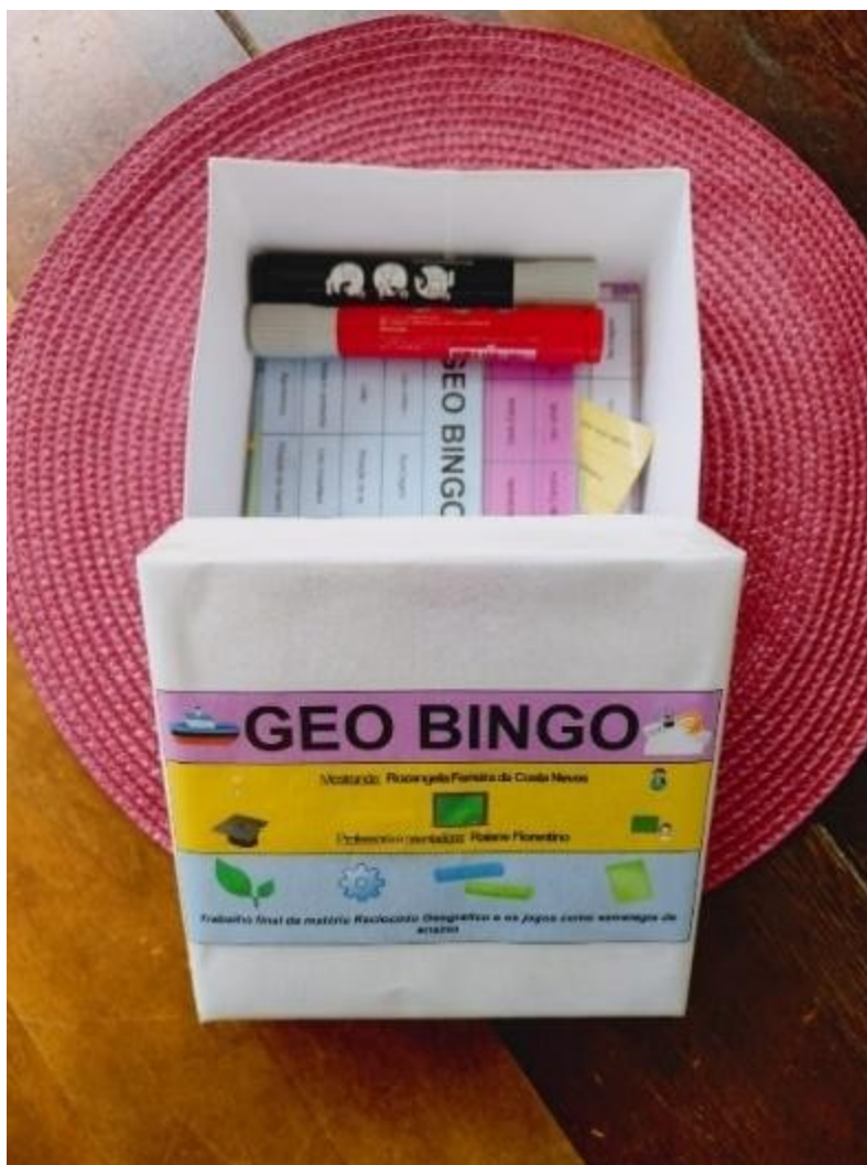
Figura 5 Jogando o Bingo educativo Autoras (2025)