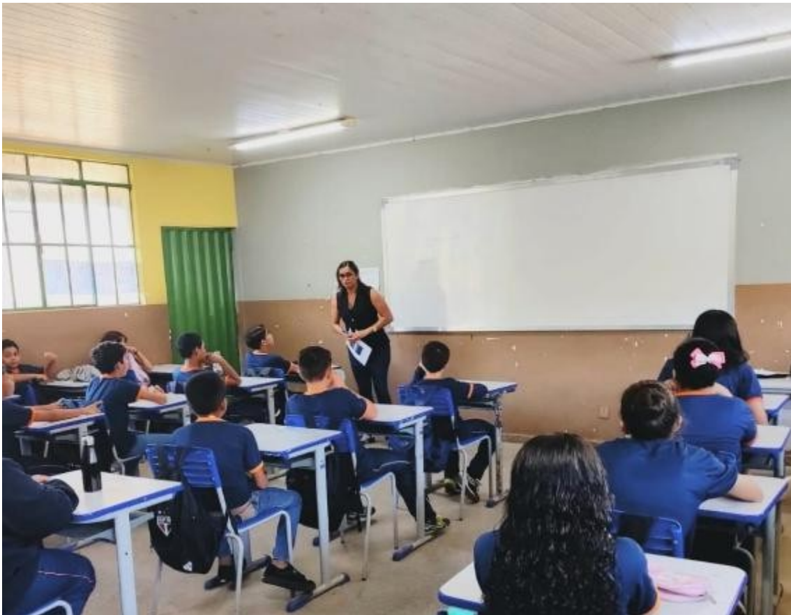
Figura 1 Revisão Conteúdo Autoras (2025)

Para a aplicação do jogo de Bingo educativo, as autoras elaboraram, inicialmente, um plano de aula em conformidade com as habilidades previstas na Base Nacional Comum Curricular (BNCC). Em seguida, o jogo foi desenvolvido e aplicado em duas turmas do 6º ano do Ensino Fundamental II da Escola Estadual Prof. Orlando Freire. A turma do 6º ano A, conforme registrado no diário de classe, possui 31 estudantes, dos quais 29 estiveram presentes. Já o 6º ano D conta com 32 estudantes, com a presença de 21 deles, totalizando 50 alunos participantes da atividade, realizada no dia 22 de março de 2025, uma sexta-feira. As turmas foram selecionadas com o objetivo de realizar comparações acerca da aplicação do jogo de bingo (Figuras 1 e 2 – 6º anos A e D, respectivamente).