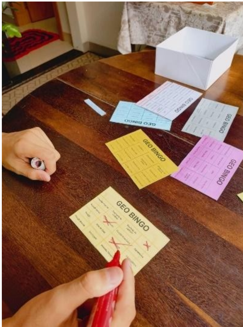
Figura 3 Jogando o Bingo educativo Autoras (2025)