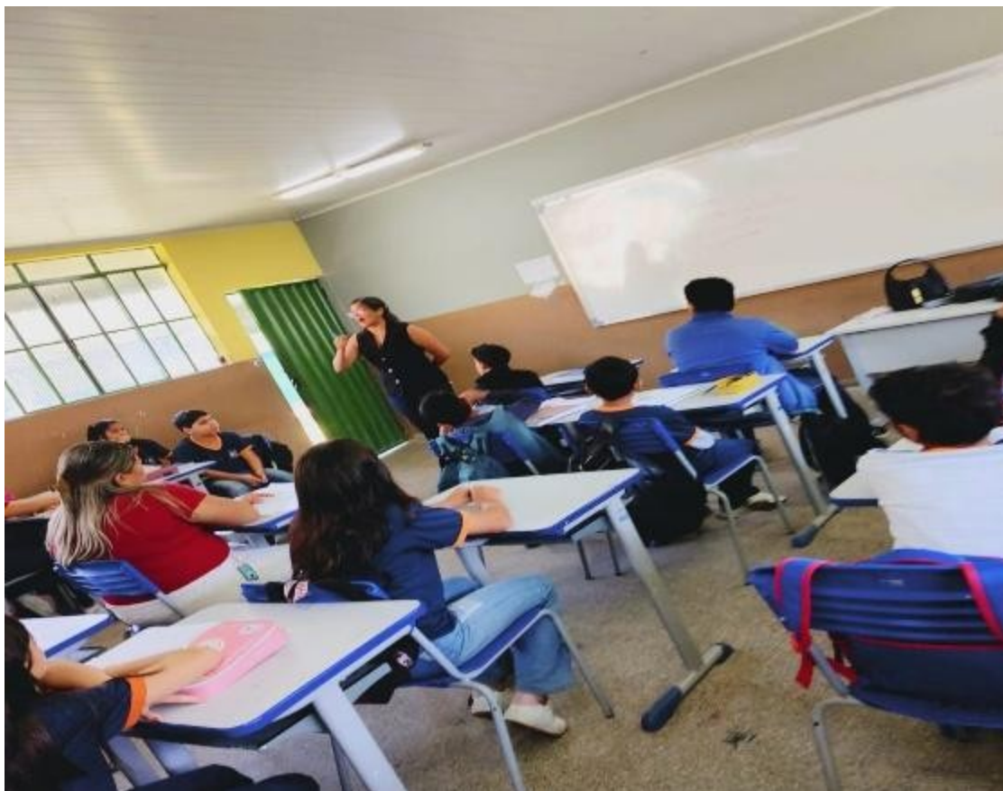
Figura 2 Revisão Conteúdo Autoras (2025)

A realização da atividade ocorreu mediante autorização formal da direção da escola e da professora responsável pela disciplina de Geografia nas turmas selecionadas.