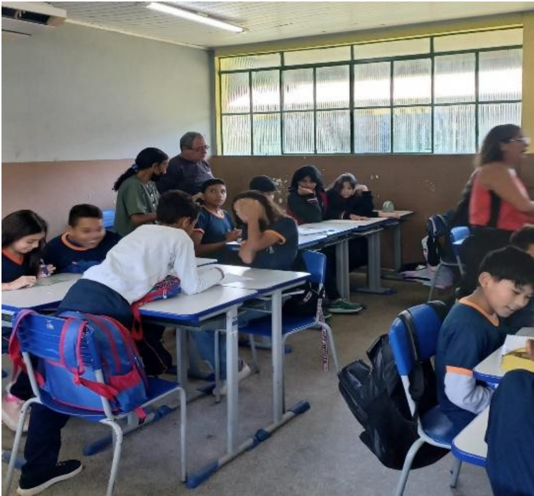
Figura 7 Jogando com os alunos Autoras (2025)

Embora a diferença no tamanho das turmas tenha influenciado a dinâmica da atividade (gráfico 1), destaca-se que, em ambas as turmas, o interesse dos estudantes pelo conteúdo foi significativo. Esse engajamento refletiu-se no desempenho satisfatório ao responder às questões propostas no jogo de bingo, o que evidencia a eficácia da estratégia em promover a assimilação do conteúdo de forma lúdica e participativa.