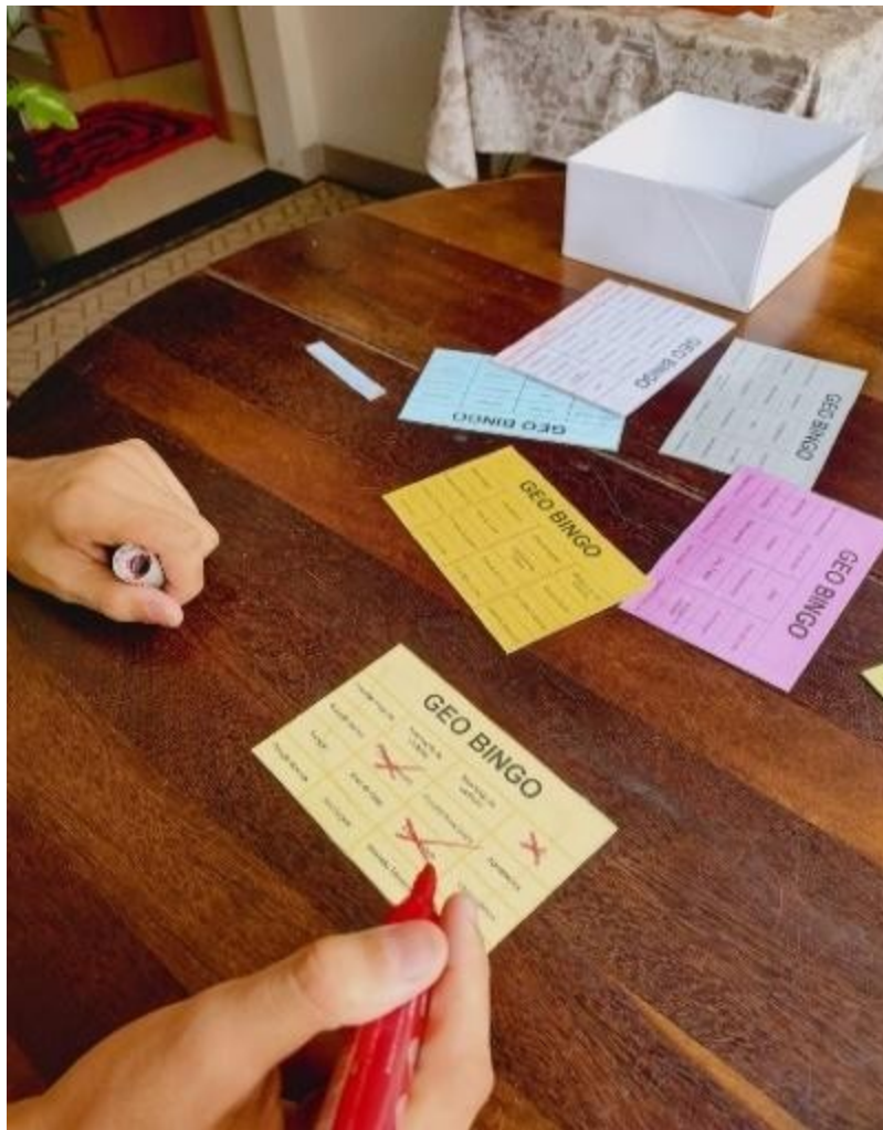
Figura 4 Jogando o Bingo educativo Autoras (2025)