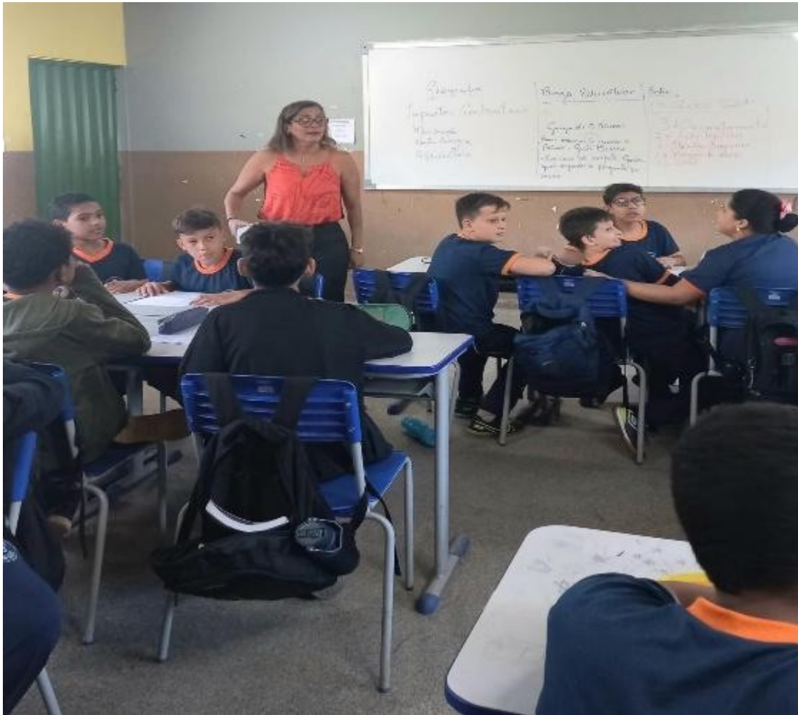
Figura 6 Jogando com os alunos Autoras (2025)

A aplicação da atividade nas turmas do 6º ano A e 6º ano D (conforme figuras 6 e 7) ocorreu, respectivamente, no 1º e 3º tempos de aula. Observou-se que a turma do 6º ano A apresentou maior dificuldade em compreender a dinâmica proposta, fator que pode ser atribuído ao número mais elevado de estudantes (29 alunos participaram). Em contraste, na turma do 6º ano D, composta por 21 alunos, a compreensão do jogo foi mais ágil, possivelmente em razão do menor número de participantes, o que facilitou a organização e a condução da atividade.