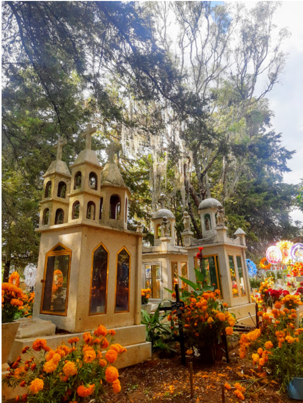
FIGURA 4 Panteón San Jerónimo Purenchécuaro

Basado en una experiencia investigativa en el pueblo de San Jerónimo Purenchécuaro, se entrevistó a una joven en el panteón de la localidad: