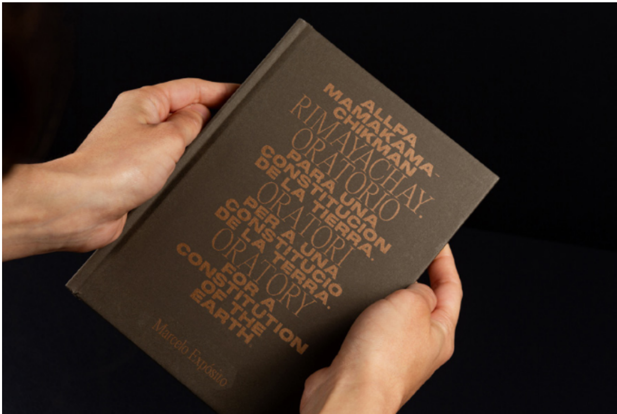
Figuras 2 y 3