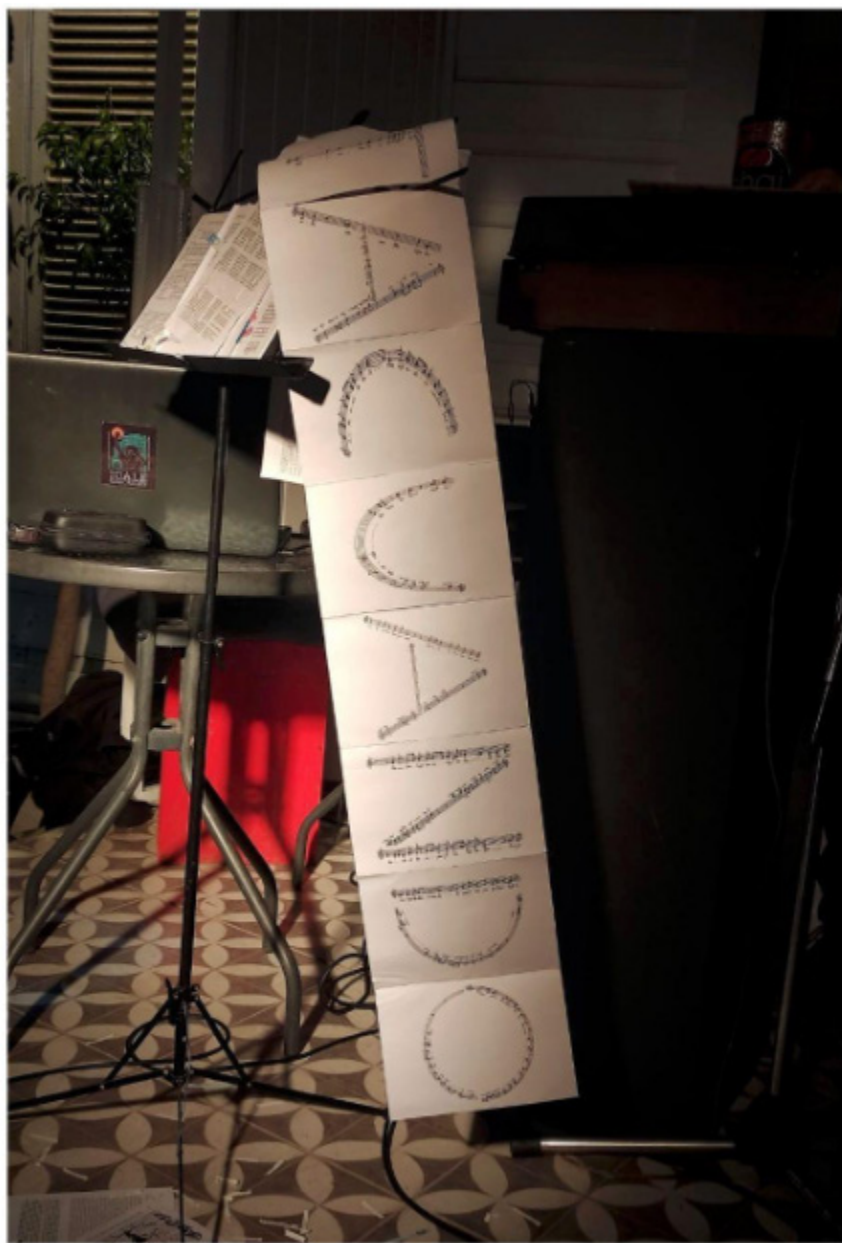
Figura 4 Registro fotográfico de la primera realización.

Figura 4. Registro fotográfico de la primera realización.