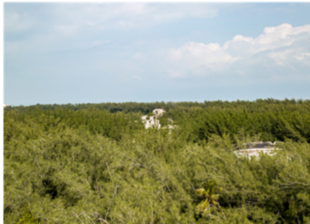
Figura 7. Ruinas circulares en Ciudad Madero, Tamaulipas, frente al Golfo de México.

La posterior doctrina imperial cristiana ha venido precedida por la fusión de este esquema político con la doctrina semítica del acabamiento de la historia, [21] es decir, el término plenario de la obra aducida a la universal deidad errante en perjuicio de las singulares ánimas. Como resultado de esta unión conceptual ha surgido el esquema —que Karl Schmitt definirá como el Nomos — bajo el cual, en un espacio de tiempo lineal, el principio de legalidad expansiva que constituye el ethos urbano occidental busca asimilar toda criatura y espacio sobre su ordenamiento fundamentado en la autorrealización de su naturaleza como el sentido último de lo humano. En contraste, todo aquello que se le opone —la naturaleza, el ethos nomádico, la voluntad de las ánimas— encarna la Anomia, es decir, las fuerzas demoniacas y el advenimiento del Apocalipsis.