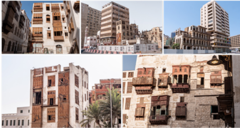
Figura 5. Barrio Histórico de Al Balad, en Yida, Arabia Saudita.

proyectos de expansión y remodelación de sus urbes. En la ciudad y puerto de Yida, frente al Mar Rojo, esta tendencia es visible en las sucesivas capas de estilos arquitectónicos distintos que, como si fueran parte de un mosaico lóbrego, laten agónicos.