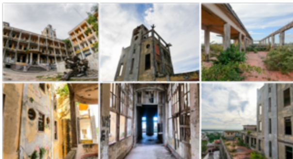
Figura 8. Ruinas del Hospital Civil en Tampico, Tamaulipas (México).

La promesa de la tierra futura ha nacido del principio de aniquilación de las ánimas arcaicas —los Baatsik, los Djinn, los Diyin diye—, aquellos espíritus cuya existencia precede a la autoconstituida comunidad humana y cuya agencia se opone al principio universalista. [22]