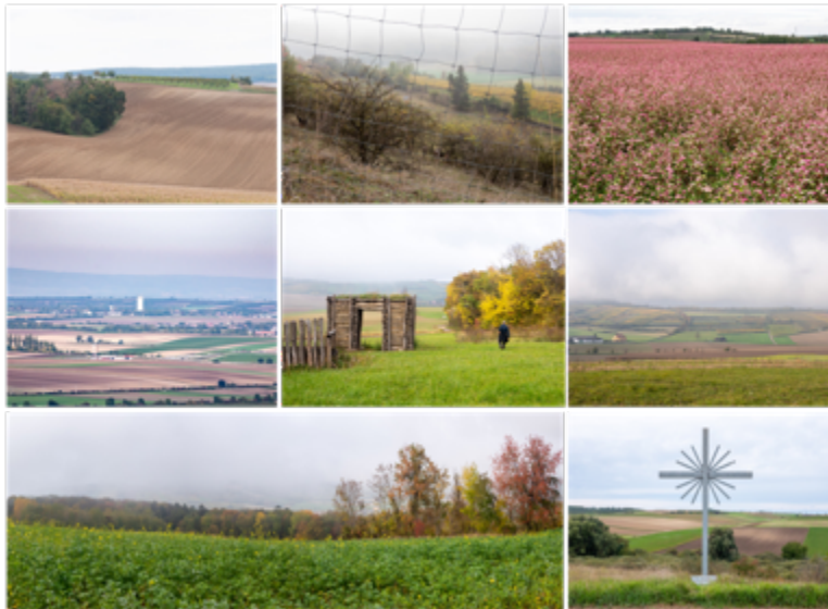
Figura 2. Campos de cultivo en el Weinviertel de Europa Central, sitio de origen de la cultura LBK.

más generaciones que sus antepasados. Y la tierra les fue propicia. Los muertos sembrados en las postrimerías de sus cultivos se fueron acumulando, lo que brindó a su progenie la fuerza de su espíritu.