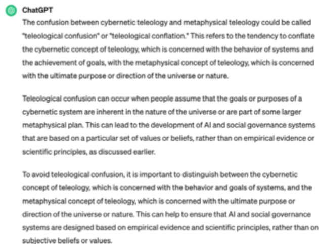
Figura 9. Conversación con ChatGPT 4.0 sobre el término de teleología en sistemas cibernéticos, 2024. https://chatgpt.com/share/4fb543b0-5b0a-4f3b-be2f-512d5d1946c7

El Apocalipsis, en su sentido anímico, no sería la destrucción del mundo a partir de la catástrofe —a fin de cuentas, nuevas formas de vida permanecerán sobre la Tierra—, sino la destrucción de la promesa de pertenencia proyectada hacia el futuro indefinidamente: una rebelión de las ánimas, donde el espacio asimilado colapsa.