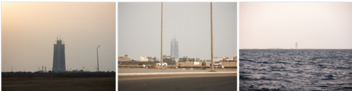
Figura 6. Torre Yeda, edificación incompleta en el nuevo Distrito Económico del Reino Saudí, frente al Mar Rojo. ©Fernando Martín Velazco, 2022.

Según la argumentación aristotélica —que es la que dará origen a las instituciones occidentales—, los grupos humanos se organizarían naturalmente en oikos , casas cuya acumulación resultaría en aldeas ( kóme ), y consiguientemente en la polis . La Política [18] es, desde esta perspectiva, la realización de una naturaleza teleológica de lo humano, la forma de organización comunal por excelencia, y el proceso único mediante el cual los vivos son capaces de dirimir los conflictos comunes e impartir justicia según sus propios intereses —que es una forma de llamar a la repartición de los bienes tangibles e intangibles, y por tanto, de la tierra.