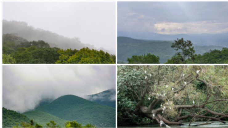
Figura 3. Paisajes de la región Huasteca (centro y noreste de México).

Visiones comparables han sido halladas en los distintos territorios de lo que en su conjunto ha sido denominado América. [6] He sido referido en Engabao, en el Pacífico ecuatoriano, sobre los antiguos enterrados vivos que resguardan el cerro adyacente, así como los ritos seguidos por los miembros de aquella comunidad ancestral para apaciguar a las ánimas de los antepasados sin nombre . De igual manera, al suroeste de los Estados Unidos he escuchado entre los Navajo sobre un particular tipo de santos de épocas remotas , Diyin diné, los cuales encarnan la sabiduría de las montañas y cuya intercesión es indispensable para los actos cotidianos.