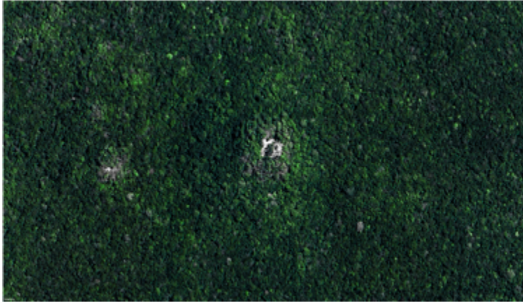
Figura 10. Conversación con ChatGPT 4.0 sobre el término de teleología en sistemas cibernéticos, 2024. https://chatgpt.com/share/4fb543b0-5b0a-4f3b-be2f-512d5d1946c7